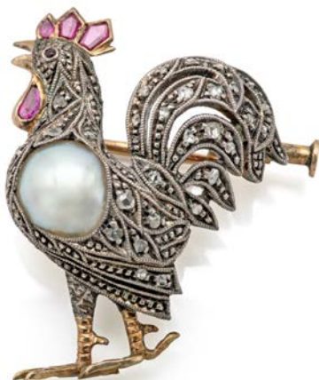
149 SPILLA ANTICA A GALLO IN ORO, ARGENTO, PERLA, DIAMANTI E PIETRE ROSSE Oro giallo 750/000 e argento. Peso complessivo gr. 5,70 cm 3x2,20