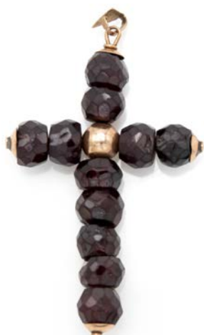
204 PENDENTE A CROCE IN ORO GIALLO E GRANATI IN TAGLIO BRIOLET

Oro giallo a basso titolo. Peso complessivo gr. 9,60.