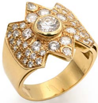
248 ANELLO IN ORO, BRILLANTE SOLITARIO E BRILLANTI Oro giallo 750/000. Diamanti in taglio rotondo brillante ct. 2 ca. Peso complessivo gr. 10,50 misura 21