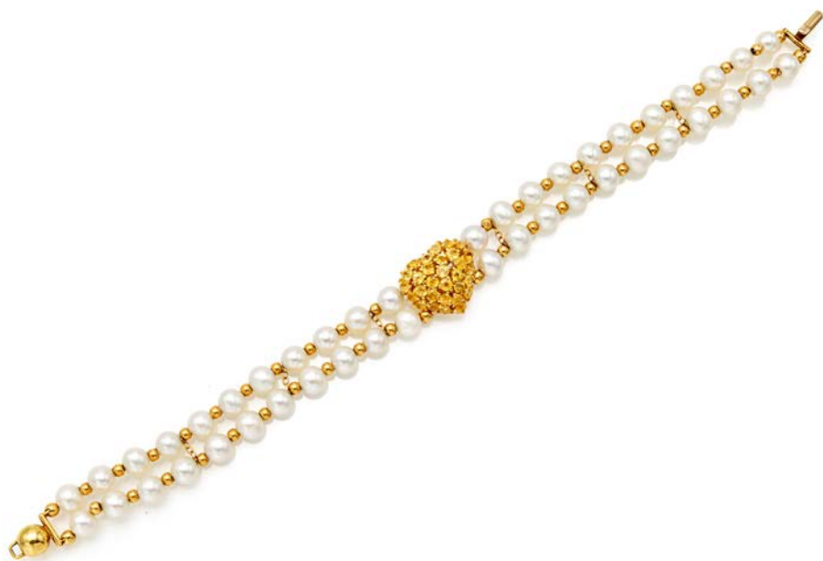
218 TREA, BRACCIALE IN ORO, PERLE E QUARZI CITRINO Oro giallo 750/000. Perle diametro mm. 5 Lunghezza cm 18