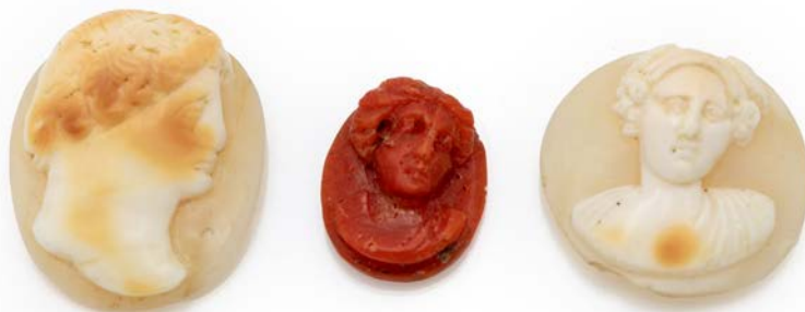
320 LOTTO DI 3 CAMMEI