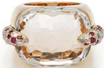
118 POMELLATO - ANELLO IN ORO, QUARZI, DIAMANTI E RUBINI, MODELLO PIN-UP Oro giallo 750/000. Peso complessivo gr. 31,20 misura 14