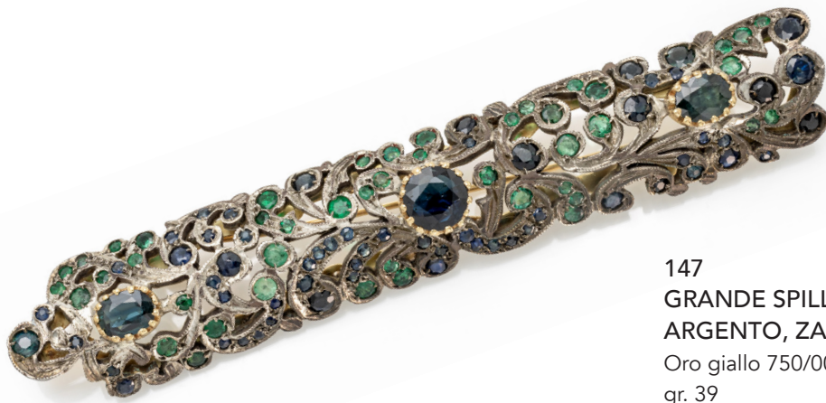
147 GRANDE SPILLA A BARRETTA IN ORO, ARGENTO, ZAFFIRI E SMERALDI Oro giallo 750/000 e argento. Peso complessivo gr. 39 Lunghezza cm 12