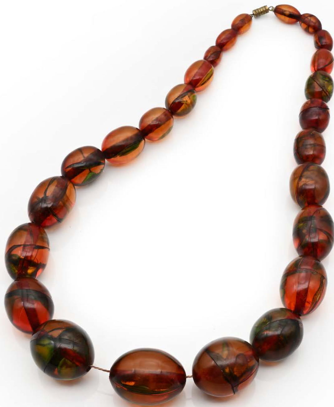
330 COLLANA IN AMBRA E METALLO Lunghezza cm 50