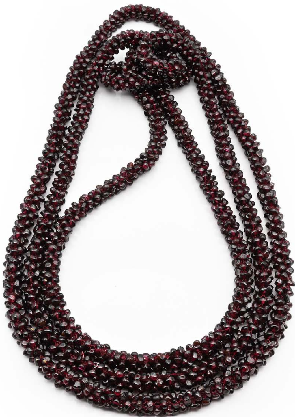
206 TRE COLLANE IN GRANATO INFILATE A TESSUTO Lunghezza cm 50