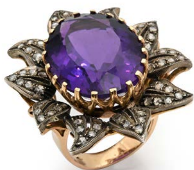
224 ANELLO AMETISTA IN ORO, ARGENTO E DIAMANTI Oro a basso titolo e argento. Peso complessivo gr. 23,70 misura 17