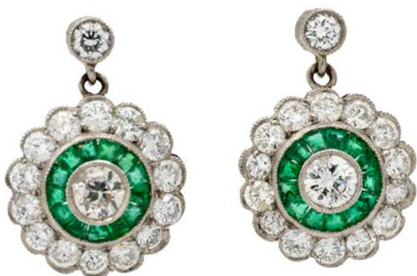
135 COPPIA DI ORECCHINI IN PLATINO, BRILLANTI E SMERALDI Platino 950/000. Peso complessivo gr. 5,10. Diametro mm 1,5