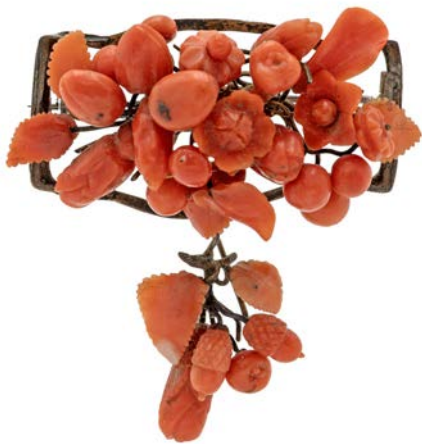
158 SPILLA IN CORALLO E METALLO cm 5 x 5