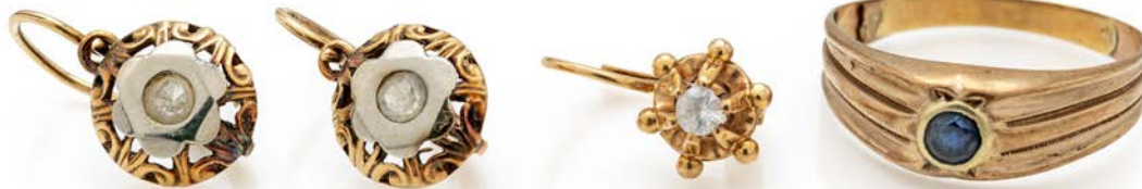
354 ANELLO A FASCIA IN ORO E RUBINI Oro giallo 750/000. Peso complessivo gr. 5,30 misura 12