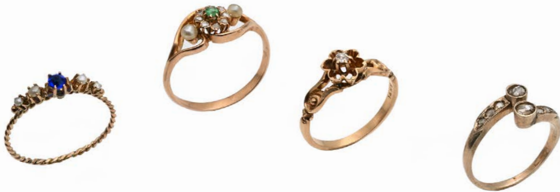
148 LOTTO DI 4 ANELLI ANTICHI IN ORO, DIAMANTI E PIETRE Oro giallo 750/000. Peso complessivo gr. 8,40