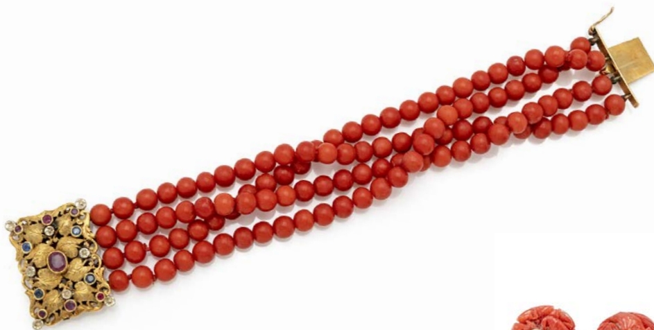
160 BRACCIALE IN CORALLO, ORO, ZAFFIRI E RUBINI

Oro giallo 750/000. Corallo in taglio sferico mm. 6. Peso complessivo gr. 52,20.