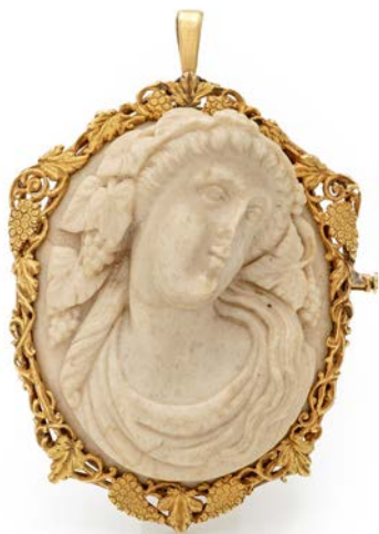
165 SPILLA IN ORO CON CAMMEO IN PIETRA LAVICA RAFFIGURANTE BACCO