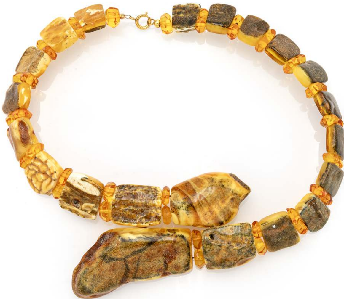
329 COLLANA IN AMBRA E QUARZI Veste cm 42