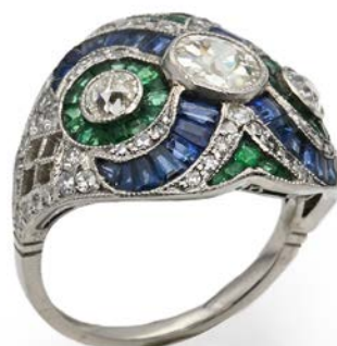
136 ANELLO TIPO DECÒ A FASCIA IN PLATINO, DIAMANTI, ZAFFIRI E SMERALDI Platino 900//000. Diamante solitario centrale in taglio antico ct. 1 ca, diamanti in taglio antico ct. 0,70 ca . Zaffiri e smeraldi in taglio calibrè. Peso complessivo gr. 9,90. misura 18