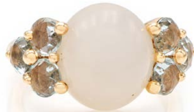
249 POMELLATO - ANELLO MODELLO LUNA IN ORO, PIETRA DI LUNA E ACQUAMARINE Oro giallo 750/000. Peso complessivo gr. 9,10 misura 14