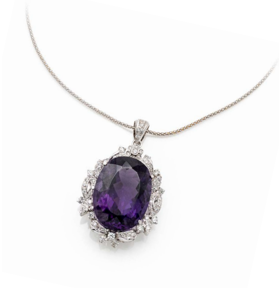
225 PENDENTE IN ORO, AMETISTA E BRILLANTI Oro bianco 750/000. Diamanti in taglio rotondo brillante ct. 1,20. Peso complessivo gr. 17 Lunghezza cm 42