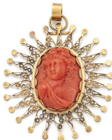
159 PENDENTE IN ORO E CORALLO Oro giallo 585/000. Peso complessivo gr. 7,60 cm 6 x 4