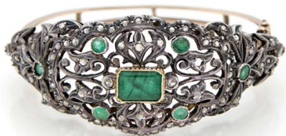
167 BRACCIALE A MANETTA TIPO XIX SEC. IN ORO, ARGENTO, DIAMANTI E SMERALDI

Oro 585/000, argento 800/000. Peso complessivo gr. 36,70.