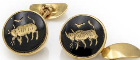
203 COPPIA DI GEMELLI IN ORO E ONICE INCISO

Oro giallo 750/000. Peso complessivo gr. 11,10