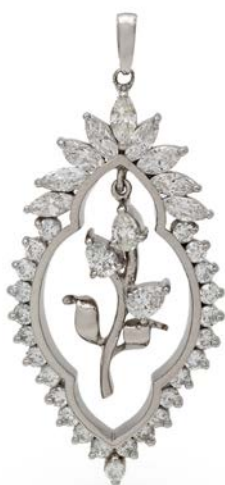
69 PENDENTE IN ORO E BRILLANTI Oro bianco 750/000. Diamanti in taglio rotondo brillante, goccia e navette. ct. 3,30. Peso complessivo gr. 12,70 cm 5x2,5