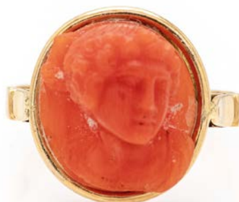
168 ANELLO IN ORO E CAMMEO IN CORALLO

Oro giallo 750/000. Peso complessivo gr. 3,80 misura 15