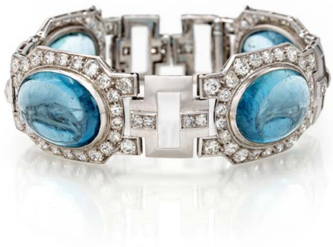
54 BRACCIALE ART DECÒ IN ORO, DIAMANTI E ACQUAMARINE IN TAGLIO CABOCHON Oro bianco 750/000. Acquamarine in taglio cabochon ct. 60ca. Diamanti in taglio rotondo ct. 5 ca. Peso complessivo gr. 44,50. Corredato di custodia d'epoca. Lunghezza cm 18