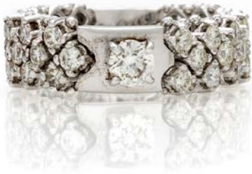
244 ANELLO A MAGLIA MORBIDA IN ORO E BRILLANTI Oro bianco 750/000. Diamanti in taglio rotondo brillante ct. 2,25. Peso complessivo gr. 7,90 misura 17