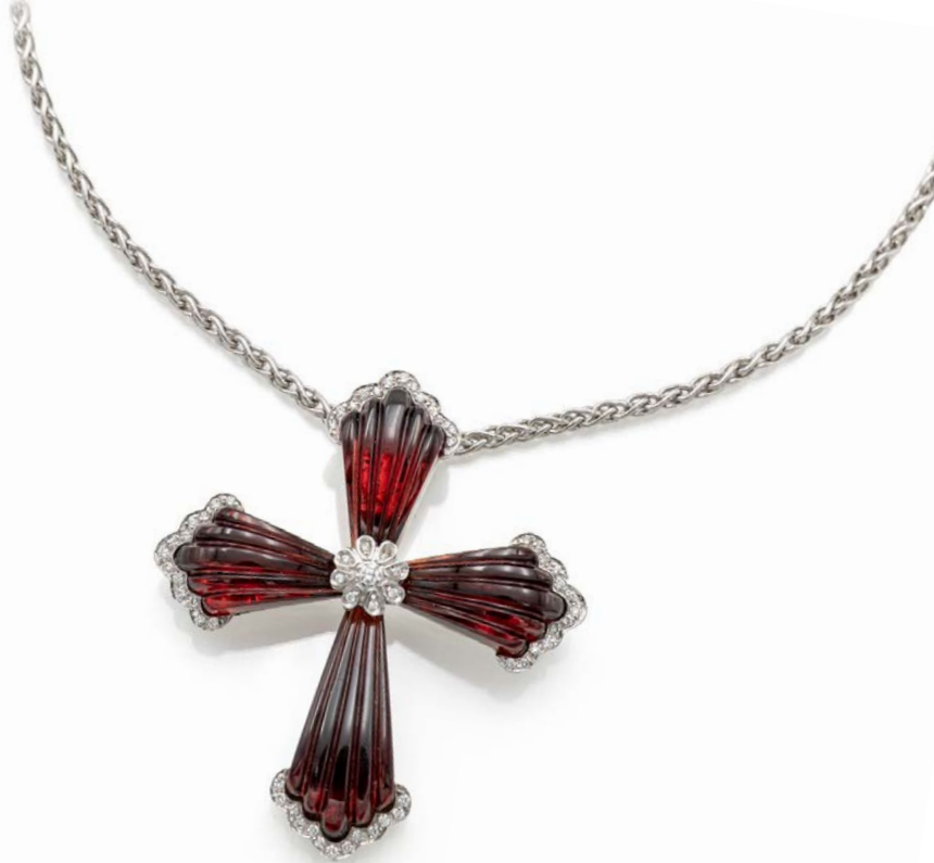
292 COLLANA CON PENDENTE A CROCE IN ORO, BRILLANTI E PIETRE ROSSE Oro bianco 750/000. Peso complessivo gr. 28,60 Lunghezza cm 45, pendente cm 5x4