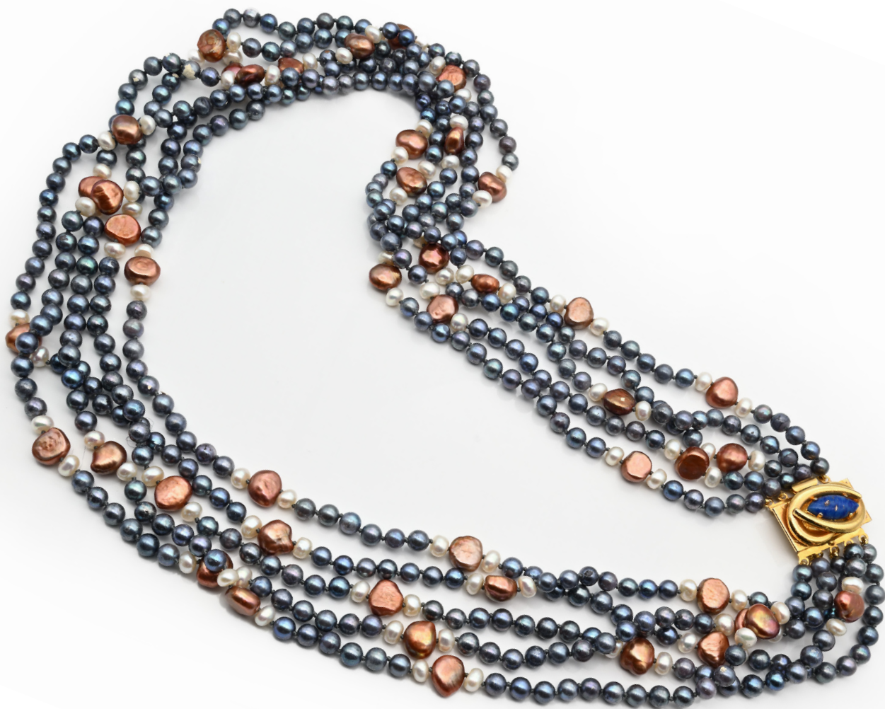
306 COLLANA IN PERLE D'ACQUA DOLCE MULTICOLOR Lunghezza cm 68