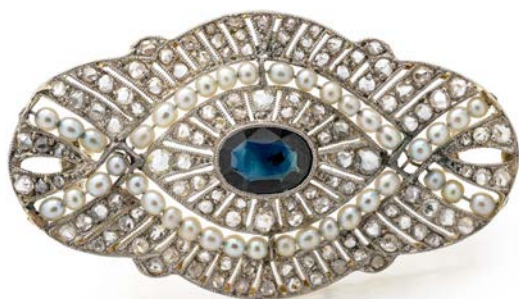
179 SPILLA DECÒ IN ORO, PLATINO, MICROPERLE DIAMANTI E ZAFFIRI Oro giallo 750/000. Peso complessivo gr. 7,30 cm 4 x 2,5