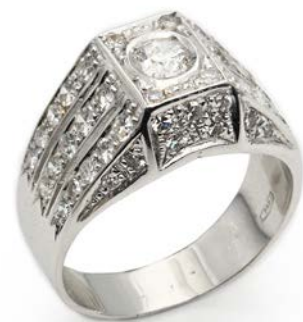
246 ANELLO A TROMBINO IN ORO E BRILLANTI Oro bianco 750/000. Diamanti in taglio rotondo brillante ct. 1,40. Peso complessivo gr. 6,50 misura 16