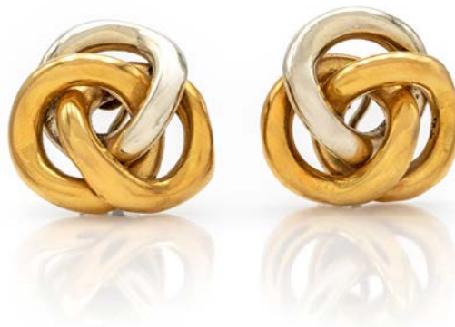
365 COPPIA DI ORECCHINI IN ORO A TRE COLORI Oro giallo e bianco 750/000. Peso complessivo gr. 18,90. Diametro mm. 26