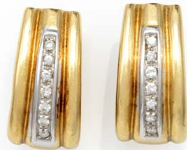
200 COPPIA DI ORECCHINI IN ORO E DIAMANTI Oro giallo 750/000. Peso complessivo gr. 13,30 cm 2 x 1