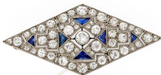
228 SPILLA A ROMBO IN ORO, ZAFFIRI E BRILLANTI Oro bianco 750/000. Diamanti in taglio rotondo e antico ct. 3,50. Peso complessivo gr. 7,80 cm 5 x 4