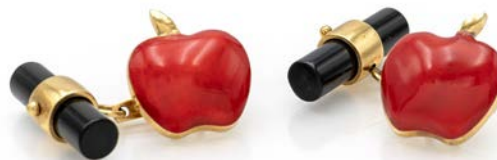
205 COPPIA DI GEMELLI IN ORO, SMALTO ED ONICE.

Oro giallo 750/000. Peso complessivo gr. 12,30