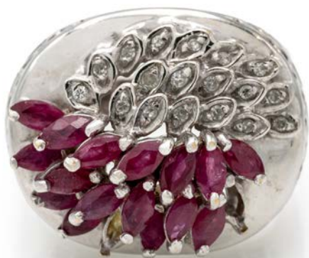
291 ANELLO IN ORO, RUBINI E BRILLANTI Oro bianco 750/000. Rubini in taglio navette, 2 rubini mancanti. Peso complessivo gr. 11,40.