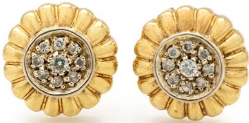
198 COPPIA DI ORECCHINI TONDI IN ORO E BRILLANTI Oro giallo 750/000. Peso complessivo gr. 5,60 Diametro mm. 13