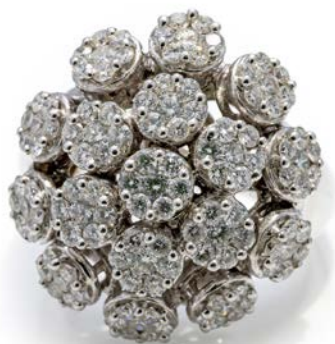
67 ANELLO A FIORI IN ORO E BRILLANTI Oro bianco 750/000. Diamanti in taglio rotondo brillante ct. 2 ca. Peso complessivo gr. 18,40 misura 23