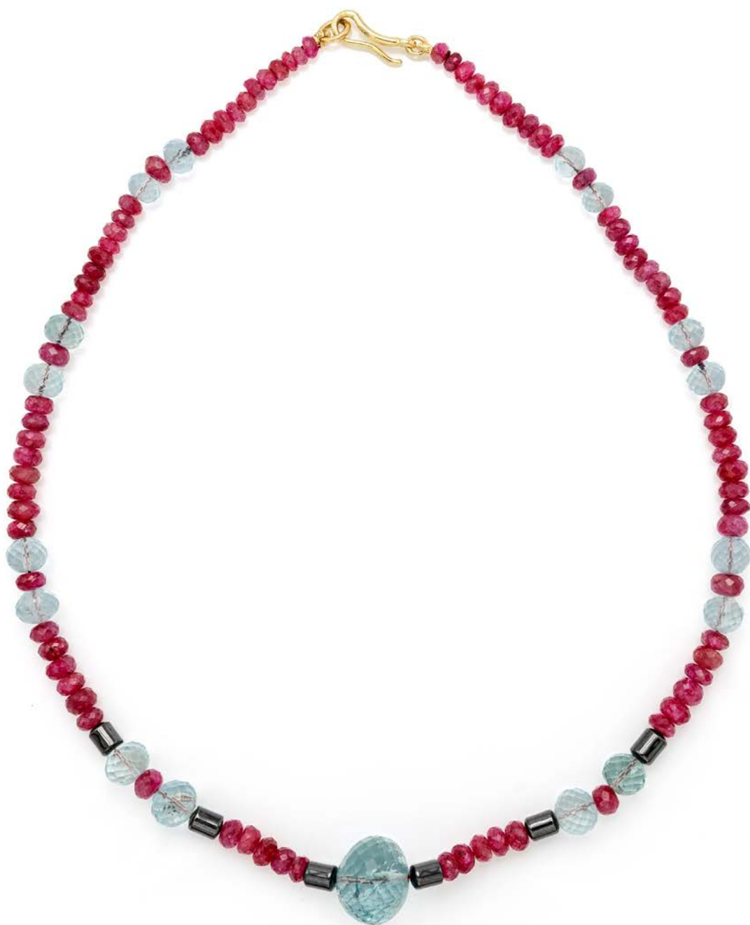
321 COLLANA IN ORO, RUBINI, EMATITE E FLUORITI Lunghezza cm 40