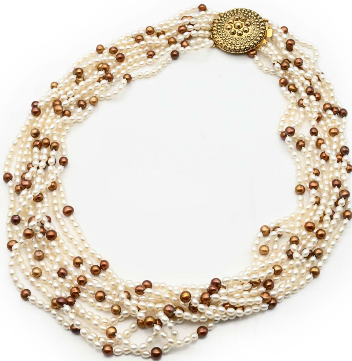
284 COLLANA DI PERLE D'ACQUA DOLCE BIANCHE E BROWN