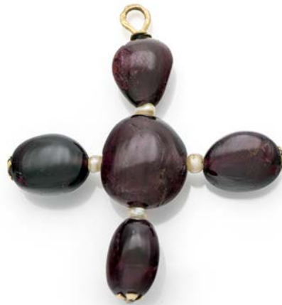
164 RARO BRACCIALE IN ORO, SPINELLI E BRILLANTI

Oro bianco 585/000. Spinelli orange brownish in taglio cabochon ct. 301,50, diamanti in taglio rotondo brillante ct. 2,13. Peso complessivo gr. 88,50. Corredato di certificazione gemmologica Masterstones n° 925PT284 del 18/09/2025. Veste polso 18,5