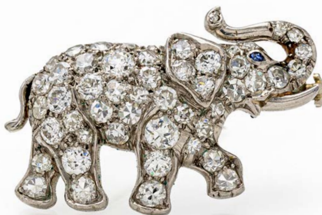
50 SPILLA ELEFANTINO IN ORO E BRILLANTI Oro bianco 750/000. Diamanti in taglio rotondo ct. 0,90 ca. Peso complessivo gr. 4,70 cm 2,5 x 2