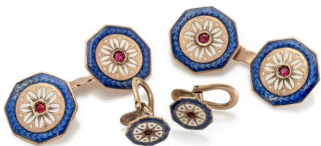
202 COPPIA DI GEMELLI E DI BOTTONI DA CAMICIA IN ORO, SMALTI E RUBINI Oro a basso titolo. Peso complessivo gr. 7