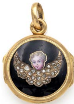
319 PENDENTE PORTAFOTO ANTICO IN ORO, DIAMANTI E SMALTO Oro giallo 750/000. Peso complessivo gr. 7,4 Diametro cm 2