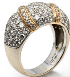
ANELLO A FASCIA IN ORO E BRILLANTI Oro bianco e rosa 750/000. Diamanti in taglio rotondo brillante ct. 1 ca. Peso complessivo gr. 8,70 misura 12