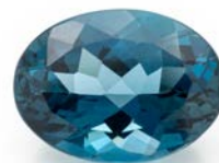
367 TOPAZIO AZZURRO IN TAGLIO OVALE CT. 29 CON CERTIFICATO DI ACQUISTO