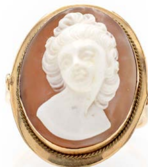
166 ANELLO IN ORO E CAMMEO

Oro giallo 750/000. Peso complessivo gr. 5,10 misura 19