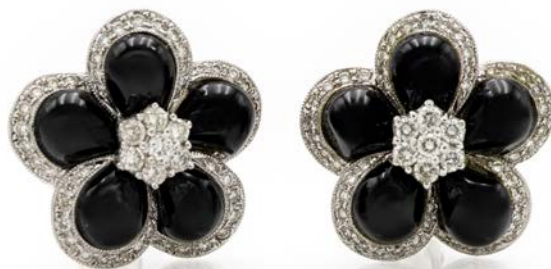
245 COPPIA DI ORECCHINI IN ORO, ONICE E BRILLANTI Oro bianco 750/000. Peso complessivo 14,30. Diametro cm 2