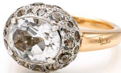
119 POMELLATO - ANELLO IN ORO ROSA E QUARZI, MODELLO TABOU Oro rosa e bianco 750/000. Peso complessivo gr. 9,80 misura 13