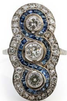
227 ANELLO TIPO DECÒ IN PLATINO, DIAMANTI E ZAFFIRI Platino 950/000. Diamanti in taglio rotondo ct. 1,30 ca. Peso complessivo gr. 6,10 misura 14