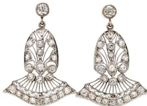
229 COPPIA DI ORECCHINI PENDENTI ART DECÒ IN ORO E BRILLANTI

Oro bianco 750/000. diamanti in taglio antico ct. 1,80 ca. Peso complessivo gr. 8,20 Lunghezza cm 4,5