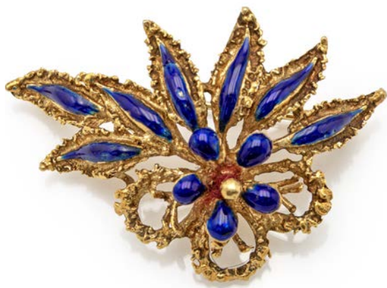
366 SPILLA IN ORO E SMALTO BLU Oro giallo 750/000. Peso complessivo gr. 12,10 cm 5 x 3