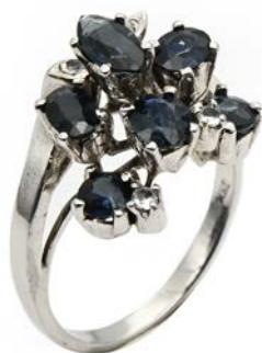
364 ANELLO A FIORE IN ORO, ZAFFIRI E PIETRE INCOLORE Oro bianco a basso titolo. Peso complessivo gr. 4,20 misura 14