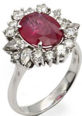
49 ANELLO IN ORO, RUBINO E BRILLANTI Oro bianco 750/000. Rubino in taglio ovale ct. 2,70, diamanti in taglio rotondo brillante e goccia ct. 1,31, F-G, VS - SI. Peso complessivo gr. 6,80. Corredato di certificazione gemmologica IGN n° 23750 del 20/02/2017. misura 15