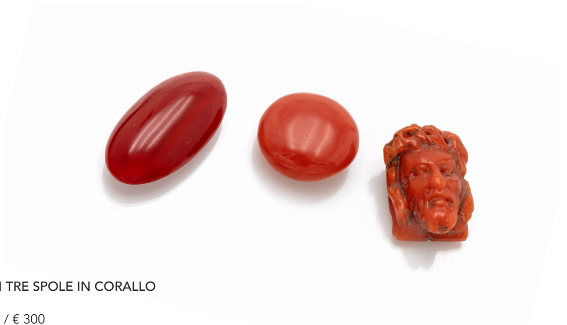
318 GRUPPO DI TRE SPOLE IN CORALLO