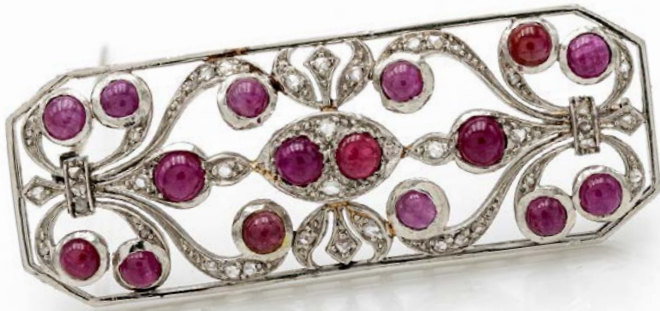
163 CROCE ANTICA IN GRANATI, ORO E PERLE NATURALI