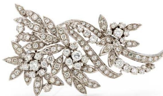
68 SPILLA IN ORO BIANCO E BRILLANTI Oro bianco 750/000. Diamanti in taglio rotondo brillante. ct. 4,5 ca. Peso complessivo gr. 16 cm 5,5x3