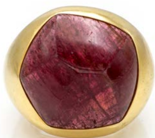
122 POMELLATO, ANELLO IN ORO E GRANATO Oro giallo 750/000. Peso complessivo gr. 24,40 misura 14