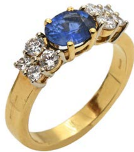
199 ANELLO IN ORO ZAFFIRO E BRILLANTI Oro giallo 750/000. Zaffiro in taglio, ovale ct. 1 ca. Peso complessivo gr. 5,20