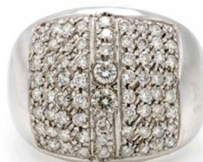
70 ANELLO A FASCIA IN ORO E BRILLANTI Oro bianco 750/000. Peso complessivo gr. 10,70