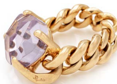
123 POMELLATO, ANELLO COLLEZIONE LOLA IN ORO E AMETISTA.

Oro giallo 750/000. Catena a maglia groumette. Peso complessivo gr. 14,60. misura 14