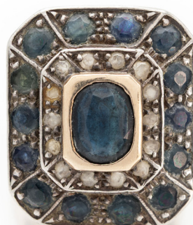
243 ANELLO ORO, ARGENTO, DIAMANTI E ZAFFIRI Oro giallo 585/000, argento. Peso complessivo gr. 8 Misura 12