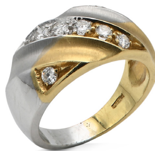
335 ANELLO A FASCIA IN ORO E BRILLANTI Oro giallo e bianco 750/000. Peso complessivo gr. 7,80 Misura 15