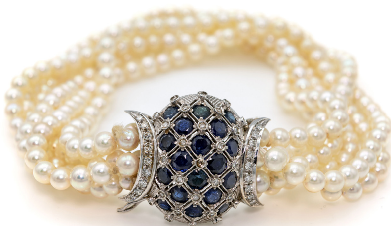
196 BRACCIALE IN PERLE, ORO DIAMANTI E ZAFFIRI Oro bianco 750/000. Perle da coltivazione mm. 4. Lunghezza cm 19