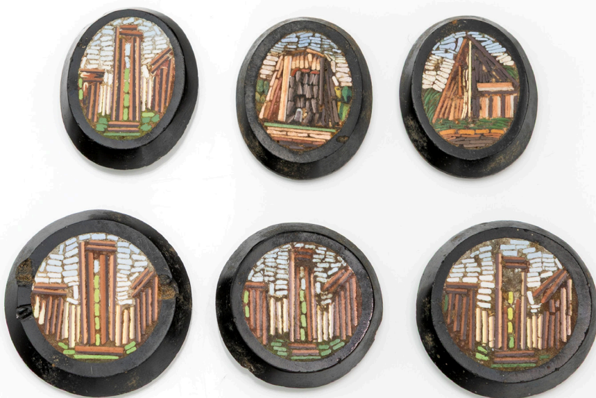
184 GRUPPO DI 6 MICROMOSAICI ANTICHI ROMANI Lievi difetti Diametro mm. 25 - 16