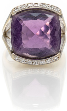
314 ANELLO A SIGILLO IN ORO, AMETISTA E BRILLANTI Oro bianco 750/000. Peso complessivo gr. 10,50 Misura 10