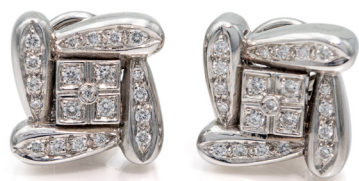
266 COPPIA DI ORECCHINI ORO E BRILLANTI Oro bianco 750/000. Diamanti in taglio rotondo brillante. Peso complessivo gr. 11. cm 1,5 x 1,5