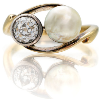
188 ANELLO ANTICO IN ORO, DIAMANTE E PERLA NATURALE FINE XIX SECOLO Oro giallo 750/000. Diamante in taglio Vecchia Europa ct. 0,50 ca. Perla naturale mm. 7,5. Peso complessivo gr. 3,30. Misura 14