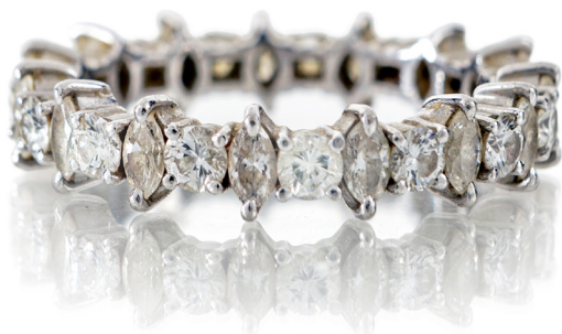
337 RIVIERA ETERNELLE IN ORO E BRILLANTI Oro bianco 750/000. Diamanti in taglio rotondo brillante e taglio navette ct. 1,20 ca. Peso complessivo gr. 4,80 Misura 11