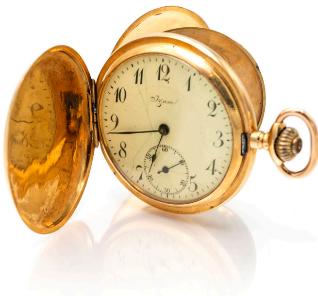
12 IZAM - OROLOGIO DA TASCA DOPPIA CASSA IN ORO ANNI '20 Oro giallo 750/000. N° 75598. Quadrante in smalto, numeri arabi, secondi in basso. Movimento con carica remontoire, 16 rubini, scappamento ad ancora, bilanciere bimetallico, spirale Breguet. Nota: quadrante filé, cassa con difetti Diametro mm. 48,5