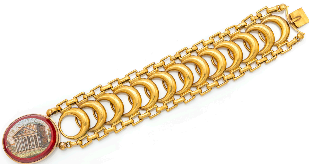
33 BRACCIALE ANTICO IN ORO E MICROMOSAICO PRIMA METÀ DEL XIX SECOLO

Oro giallo 750/000. Peso complessivo gr. 25,20.