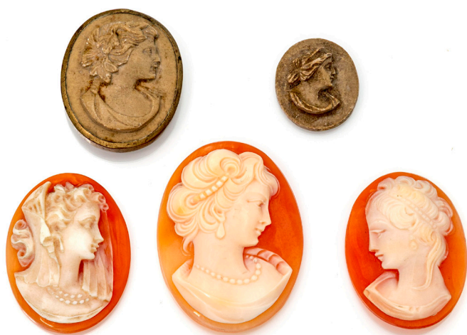
183 GRUPPO DI 5 CAMMEI Conchiglia e pietra lavica mm 25 x 15