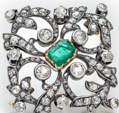
311 SPILLA A ROMBO IN ORO, DIAMANTI E SMERALDO Oro giallo e bianco 750/000. Peso complessivo gr. 9,60 Diametro cm 4