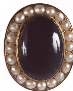
182 SPILLA IN ORO CON PERLINE E PIETRA CENTRALE Oro giallo 750/000. Peso complessivo gr. 12,50 Cm 3 x 2,2