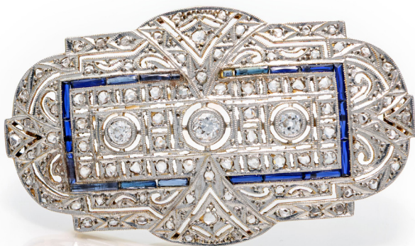
299 SPILLA DECÒ IN ORO, PLATINO, DIAMANTI E ZAFFIRI Oro giallo 750/000, platino. Diamanti in taglio rotondo. Peso complessivo gr. 10,70 cm 5 x 3