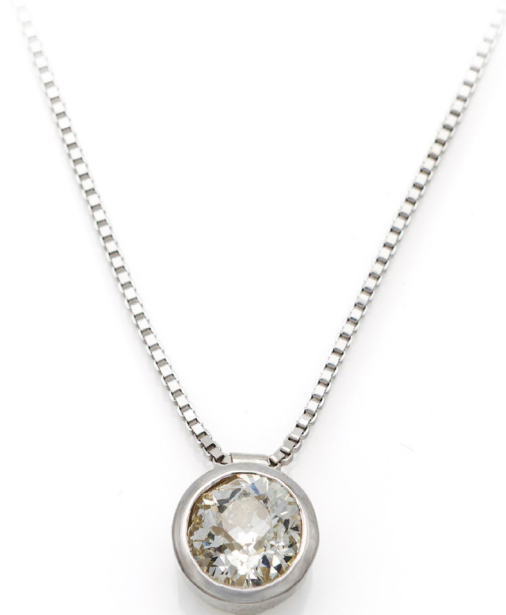
265 PENDENTE PUNTO LUCE IN ORO E DIAMANTI Oro bianco 750/000. Diamante in taglio vecchia Europa ct. 0,90. Peso complessivo gr. 3,70 Lunghezza cm 43