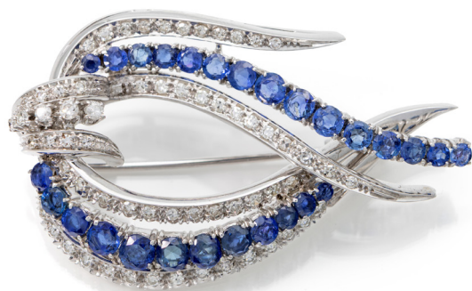
340 SPILLA A GOCCIA ORO, ZAFFIRI E BRILLANTI Oro bianco 750/000. Peso complessivo gr. 15,40 Lunghezza cm 5