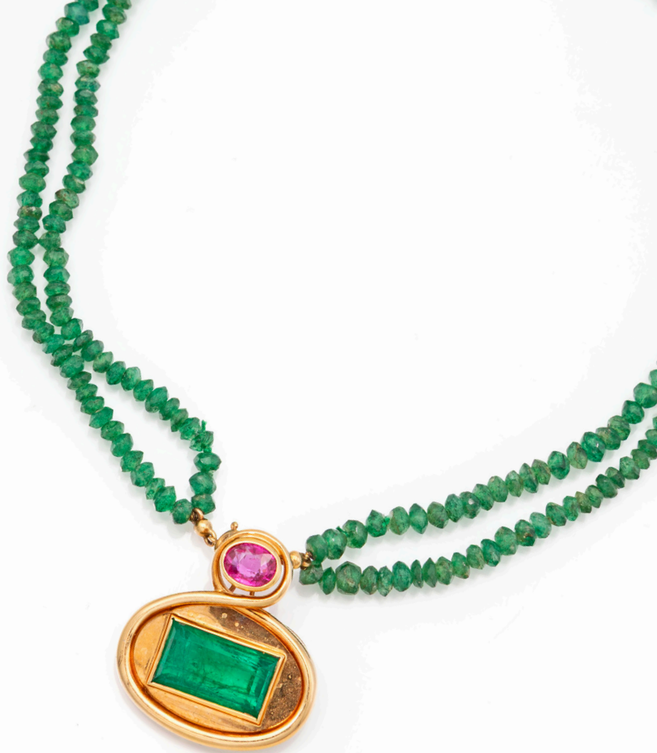
78 PETOCHI PENDENTE IN ORO SMERALDO, ZAFFIRO ROSA E AVVENTURINA Oro giallo 750/000. Zaffiro rosa in taglio ovale ct. 1,80, SENZA INDICAZIONE DI TRATTAMENTO TERMICO, smeraldo naturale in taglio ottagonale ct. 11,50 Colombia, avventurina in taglio facettato briolet da mm. 4,10 a 5,40. Peso complessivo gr. 40,90. Corredato di certificazione gemmologica IGN n° 36551 del 11/12/24. pendente cm 4