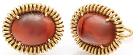
263 COPPIA DI ORECCHINI IN ORO E CORNIOLO Oro giallo 750/000. Peso complessivo gr. 22,70. mm 21 x 27