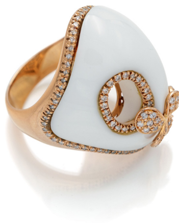
252 DD GIOIELLI, ANELLO IN ORO, BRILLANTI E CERAMICA Oro rosa 750/000. Diamanti in taglio rotondo brillante. Peso complessivo gr. 16,20. Misura 18