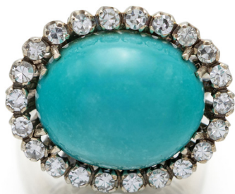
278 ANELLO IN ORO, TURCHESE E BRILLANTI Oro bianco 750/000. Peso complessivo gr. 11,10. Misura 15