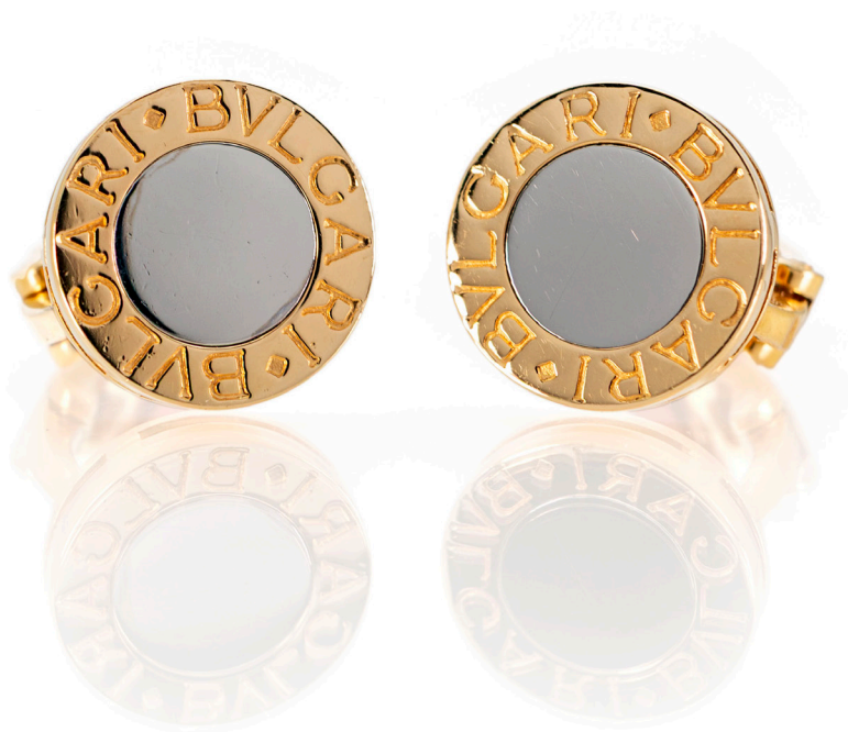
35 BULGARI, ORECCHINI IN ORO E ACCIAIO Oro giallo 750/000, acciaio. Peso complessivo gr. 11,10. Diametro mm. 15