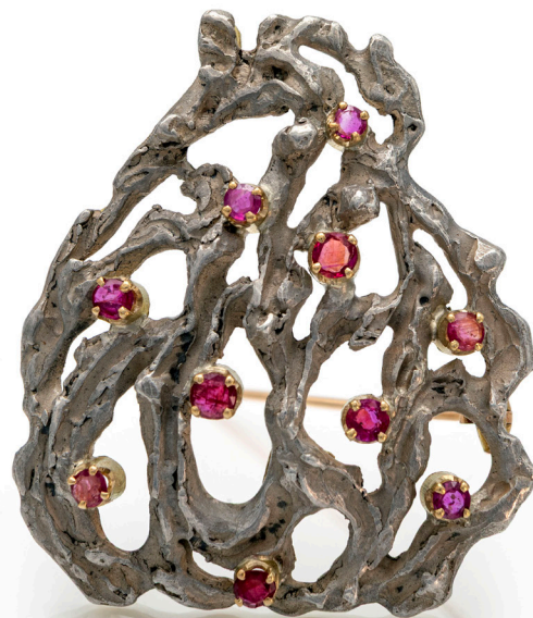
40 SFORZA, SPILLA IN ORO E RUBINI Oro giallo e bianco 750/000. Peso complessivo gr. 23 cm 5 x 4