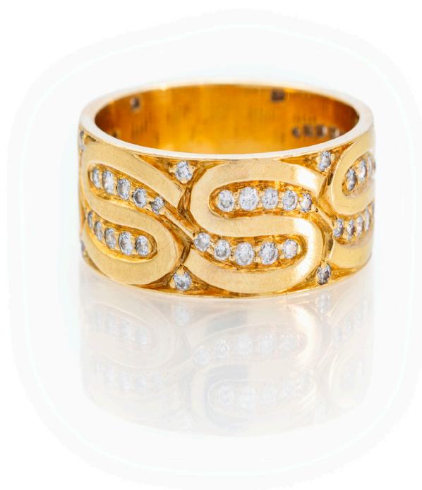
36 BULGARI, RARO ANELLO A FASCIA, CON DECORO AD "S" IN ORO E BRILLANTI Oro giallo 800/000. Peso complessivo gr. 6,70 Misura 12