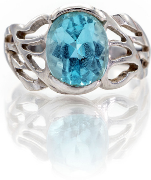
345 ANELLO IN ORO E PIETRA AZZURRA Oro bianco 750/000. Peso complessivo gr. 4,70 Misura 17