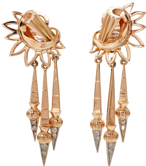
221 COPPIA DI ORECCHINI PENDENTI IN ORO E DIAMANTI ART RETRÒ Oro rosa 750/000. Peso complessivo gr. 15,70 Lunghezza cm 6