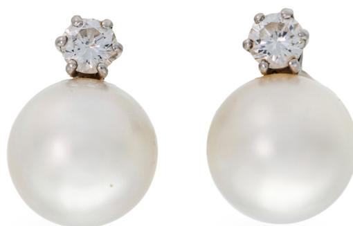
297 COPPIA DI ORECCHINI IN ORO, PERLE E BRILLANTI Oro bianco 750/000. Perle South Sea mm. 13, diamanti in taglio rotondo brillante ct. 0,70 ca. Peso complessivo gr. 12. cm 2