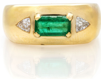
217 ANELLO DA UOMO IN ORO, SMERALDO E BRILLANTI Oro giallo 750/000. Smeraldo centrale in taglio smeraldo, diamanti naturali in taglio triangolo. Peso complessivo gr. 8,80 Misura 13