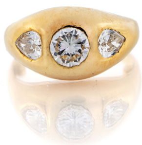
225 ANELLO A FASCIA IN ORO E DIAMANTI Oro giallo 750/000. Diamanti in taglio rotondo brillante e goccia. Peso complessivo gr. 6. Misura 12