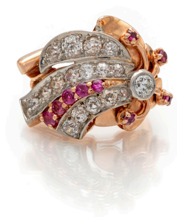
155 ANELLO A FASCIA IN ORO E DIAMANTI IN TAGLIO CARRÈ Oro giallo 750/000. Diamanti in taglio carrè ct. 2,30 ca., prob G, VVS. Peso complessivo gr. 11,40. Misura 16