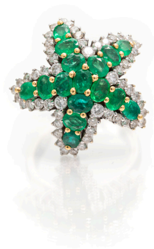
159 ANELLO A STELLA IN ORO, BRILLANTI E SMERALDI Oro bianco 750/000. Smeraldi in taglio rotondo ct. 6, diamanti in taglio rotondo brillante ct. 1,50. Peso complessivo gr. 14,70. Misura 15