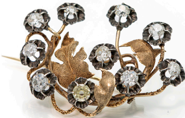
39 MARIO BUCCELLATI, SPILLA ANTICA IN ORO, ARGENTO E DIAMANTI Oro giallo 750/000, argento. Diamanti in taglio antico ct. 2,20 ca. Peso complessivo gr. 11,20. Corredata di custodia originale. cm 5 x 4