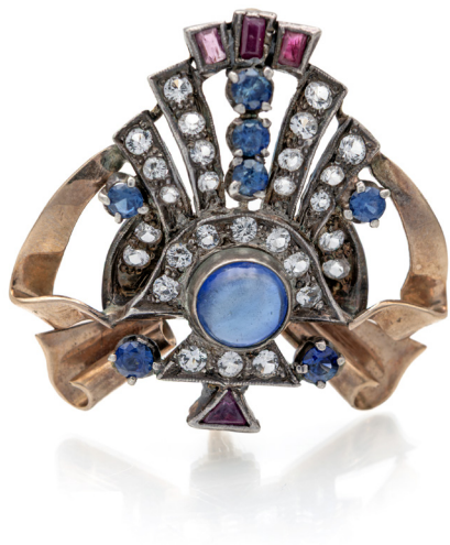
198 SPILLA IN ORO E PIETRE ANNI '40 Oro giallo a basso titolo. Peso complessivo gr. 10,50.