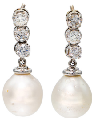
296 COPPIA DI ORECCHINI PENDENTI IN ORO, PERLE E BRILLANTI Oro bianco 750/000. Perle South Sea mm 11,5. Diamanti in taglio rotondo brillante ct. 0,60 ca. Peso complessivo gr. 9,4.