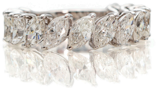
118 ANELLO A RIVIERA IN ORO E DIAMANTI IN TAGLIO NAVETTE Oro bianco 750/000. 15 diamanti in taglio navette ct. 3 ca, prob F, IF-VVS. Peso complessivo gr. 3,90 Misura 13