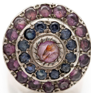
241 ANELLO IN ORO, ARGENTO, RUBINI E ZAFFIRI Oro giallo 585/000, argento. Peso complessivo gr. 10,30 Misura 12