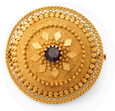
179 SPILLA TONDA IN ORO E GRANATO CENTRALE Oro giallo 750/000. Peso complessivo gr. 12,80 Diametro cm 4