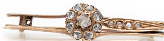
301 SPILLA A BARRETTA IN ORO E DIAMANTI Oro giallo a basso titolo. Peso complessivo gr. 5,70. Mancanze. cm 4,5