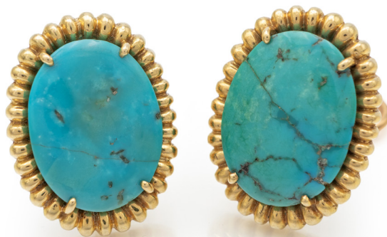
279 COPPIA DI ORECCHINI IN ORO E TURCHESE Oro giallo 750/000. Peso complessivo gr. 23,70. cm 3 x 2