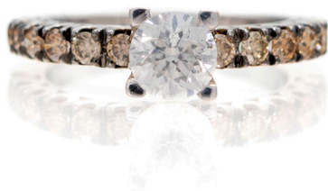
174 ANELLO A RIVIERA IN ORO, BRILLANTI E BRILLANTE SOLITARIO CENTRALE Oro bianco 750/000. Diamante solitario centrale in taglio rotondo brillante ct. 1 ca., diamanti fancy color naturali ct. 0,70 ca. Peso complessivo gr. 4,60 Misura 15