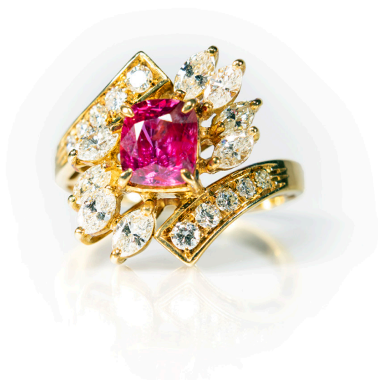
205 ANELLO IN ORO, RUBINO E DIAMANTI Oro giallo 750/000. Rubino naturale in taglio cuscino, diamanti in taglio navette e taglio rotondo brillante. Peso complessivo gr. 8,50 Misura 17