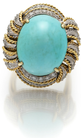
271 ANELLO IN ORO, TURCHESE E BRILLANTI Oro giallo 585/000. Peso complessivo gr. 12,20 Misura 14