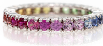
253 RIVIERA ETERNELLE IN ORO E ZAFFIRI Oro bianco 750/000. Zaffiri blu, verdi, rosa. Peso complessivo gr. 2,80 Misura 13