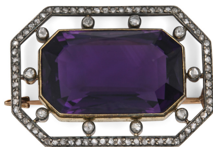
300 SPILLA ANTICA IN ORO, ARGENTO, AMETISTA E DIAMANTI Oro giallo 750/000, argento. Diamanti in taglio rotondo, ametista in taglio smeraldo ct. 30 ca. Peso complessivo gr 27,90 cm 5x3,5