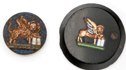
181 COPPIA DI MICROMOSAICI ANTICHI CON LEONE DI VENEZIA Lievi difetti mm 25 - mm 21 x 18