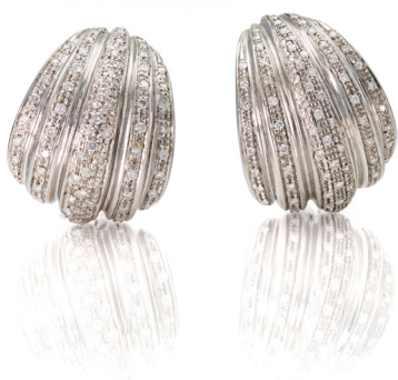
292 COPPIA DI ORECCHINI IN ORO E BRILLANTI Oro giallo 750/000. Peso complessivo gr. 18,90 Lunghezza cm 2,5