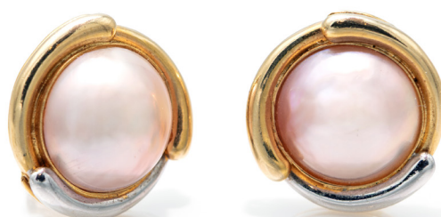
329 COPPIA DI ORECCHINI IN ORO E PERLE MABÈ Oro giallo 750/000 e 850 mm. Peso complessivo gr. 29,30. Diametro 2,5 cm.