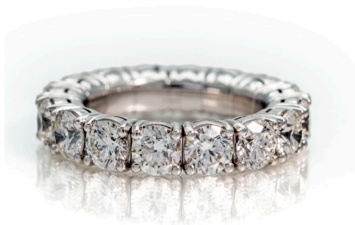
120 RIVIERA ETERNELLE IN ORO E BRILLANTI Oro bianco 750/000. Diamanti in taglio rotondo brillante ct. 5,20, D-E, VVS-VS. Peso complessivo gr. 7,20. La misura dell'anello è modificabili grazie ad un sistema brevettato di estensione. Corredato di certificazione gemmologica HRD n° J230000070840. Misura 12/18