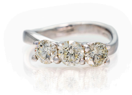
175 ANELLO TRILOGY IN ORO E BRILLANTI Oro bianco 750/000. Diamanti in taglio rotondo brillante ct. 1,60 ca. Peso complessivo gr. 5,10 Misura 14