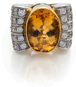
164 ANELLO IN ORO, QUARZO CITRINO E BRILLANTI Oro giallo e bianco 750/000. Peso complessivo gr. 20,60 Misura 15