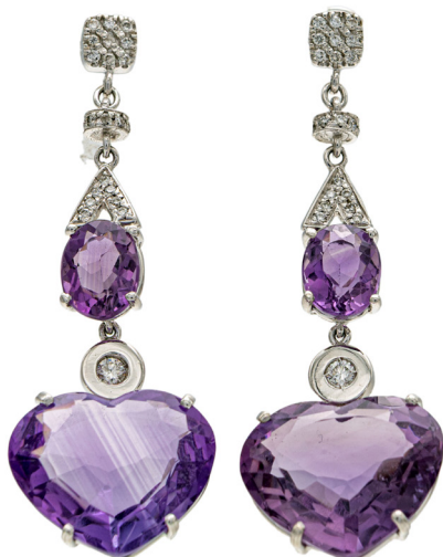
190 COPPIA DI ORECCHINI IN ORO, AMETISTE E BRILLANTI Oro bianco 750/000. Peso complessivo gr. 12,70 Lunghezza cm 5,50