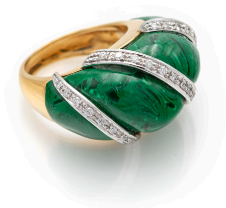
146 ANELLO IN ORO, SMALTI E BRILLANTI Oro giallo e bianco 750/000. Peso complessivo gr. 14,80 Misura 14