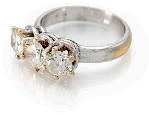
112 ANELLO TRILOGY IN ORO E BRILLANTI Oro bianco 750/000. Diamanti in taglio rotondo brillante ct. 1,90, inf. K, VS. Peso complessivo gr. 5,60. Corredato di certificazione gemmologica Misura 11