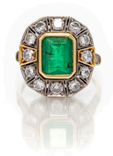
206 ANELLO IN ORO, SMERALDO E BRILLANTI Oro bianco 750/000. Smeraldo in taglio smeraldo ct. 2,80 ca. , diamanti in taglio rotondo brillante 0,80. Peso complessivo gr. 7 Misura 20