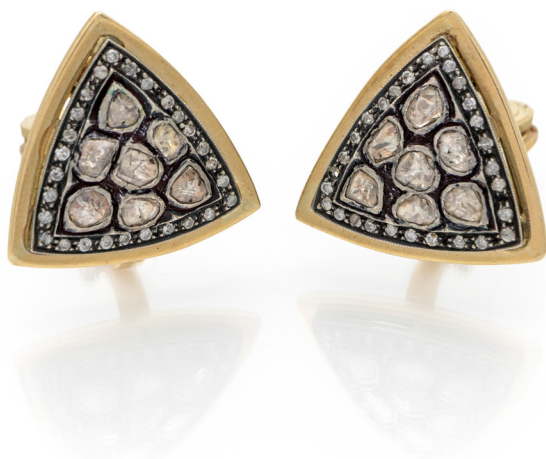
257 ORECCHINI IN ORO, ARGENTO E DIAMANTI Oro giallo 750/000. Peso complessivo gr. 16,80. mm 23 x 23