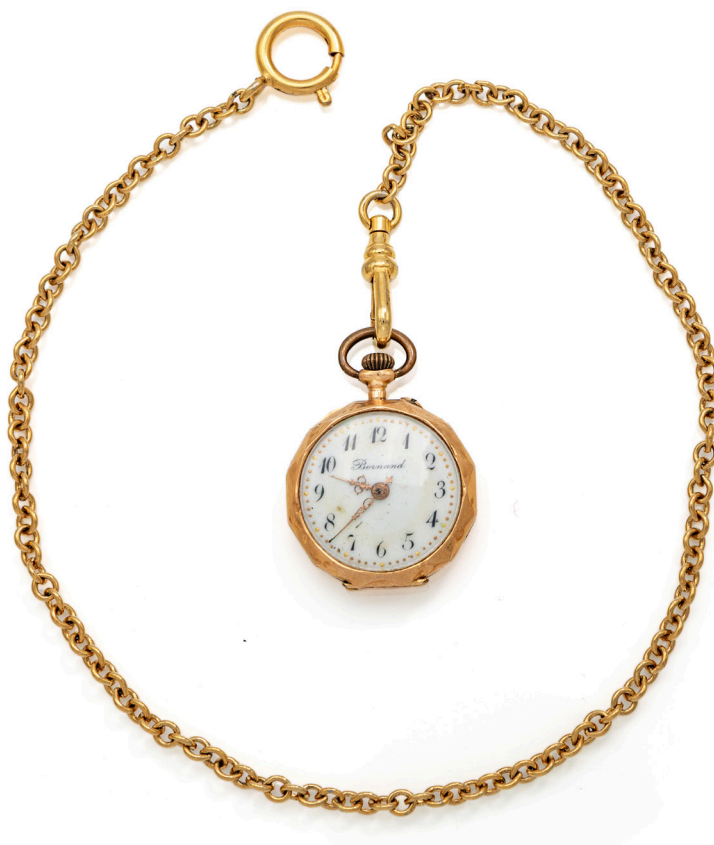
13 BORNARD - OROLOGIO DA TASCA IN ORO CON CATENA IN METALLO DORATO 1900 Oro giallo 750/000. Cuvette in metallo dorato. Fondello inciso a volute con scritta ricordo. Quadrante in smalto bianco, numeri arabi. Movimento con carica a remontoire, scappamento a cilindro. Catena in metallo dorato. Nota: asse di bilanciere rotto. Diametro mm. 25