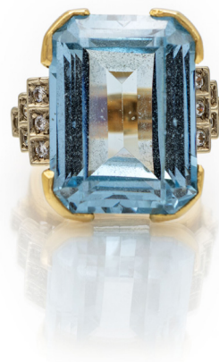
316 ANELLO IN ORO, TOPAZIO AZZURRO E BRILLANTI Oro giallo 750/000. Peso complessivo gr. 16,80 Misura 12