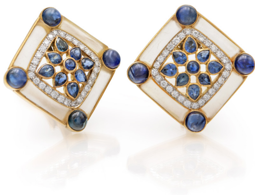
274 COPPIA DI ORECCHINI IN ORO, BRILLANTI, ZAFFIRI E CRISTALLO DI ROCCA Oro giallo 750 mm. Peso complessivo gr. 21,80 cm 2,5x2,5