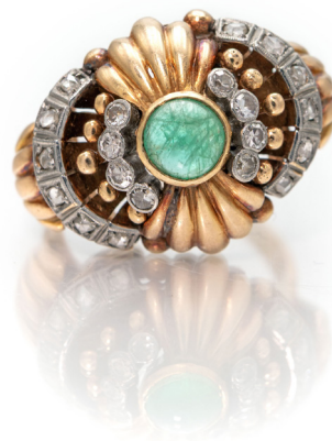
218 ANELLO A CUPOLA IN ORO, BRILLANTI E SMERALDO CENTRALE ART RETRÒ Oro rosa 750/000. Peso complessivo gr. 6,60. Misura 15