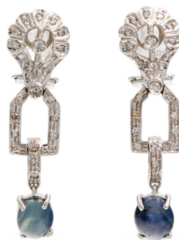
267 COPPIA DI ORECCHINI PENDENTI IN ORO, DIAMANTI E ZAFFIRI Oro bianco 750/000. Peso complessivo gr. 10,70 Lunghezza cm 4