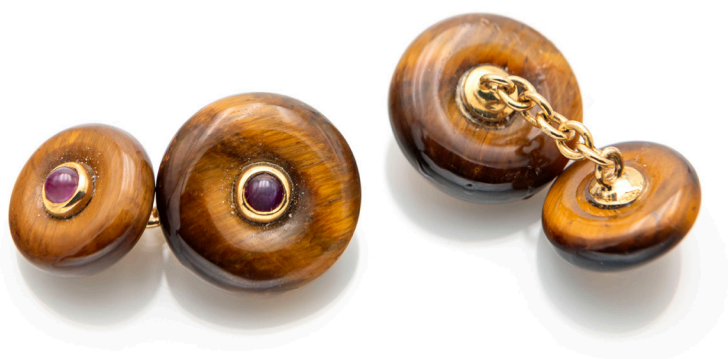
28 COPPIA DI GEMELLI IN ORO, OCCHIO DI TIGRE E RUBINI Oro giallo 750/000. Diametro mm 12