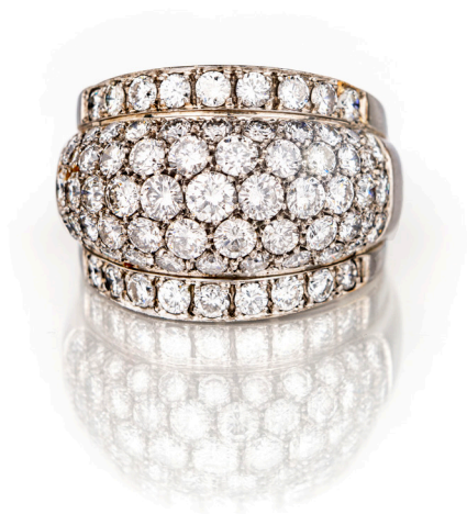
116 ANELLO A FASCIA IN ORO E BRILLANTI Oro bianco 750/000. Diamanti taglio rotondo brillante, ct. 3,10 ca., G-H, VVS- VS. Peso complessivo gr 16,50