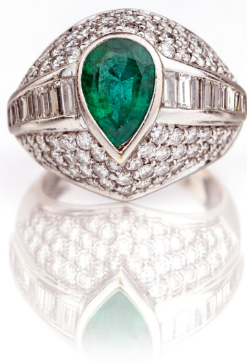
315 ANELLO IN ORO, DIAMANTI E SMERALDO Oro bianco 750/000. Smeraldo naturale in taglio goccia ct. 2,00 ca. Diamanti in taglio rotondo brillante e taglio baguette, ct. 2.00 ca. Prob. G, VVS-VS Misura 17