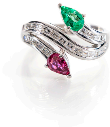
144 ANELLO CONTRARIÈ IN ORO, SMERALDO, RUBINO E DIAMANTI Oro bianco 750/000. Peso complessivo gr. 7,20. Iscrizione interna Tiffany & co. Misura 17