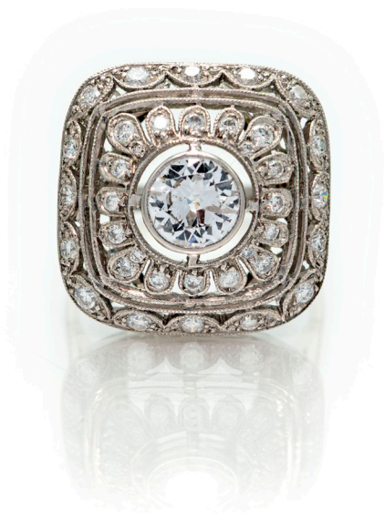
110 ANELLO IN ORO, BRILLANTE SOLITARIO E DIAMANTI Oro bianco 750/000. Diamante solitario centrale ct. 0,90 ca. Peso complessivo gr. 7,20. Misura 14