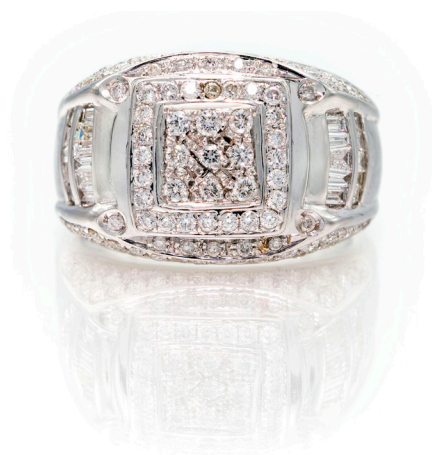
122 ANELLO DA UOMO A FASCIONE IN ORO E BRILLANTI Oro bianco 750/000. Diamanti in taglio rotondo brillante ct. 1,50 ca. Peso complessivo gr. 14. Misura 21