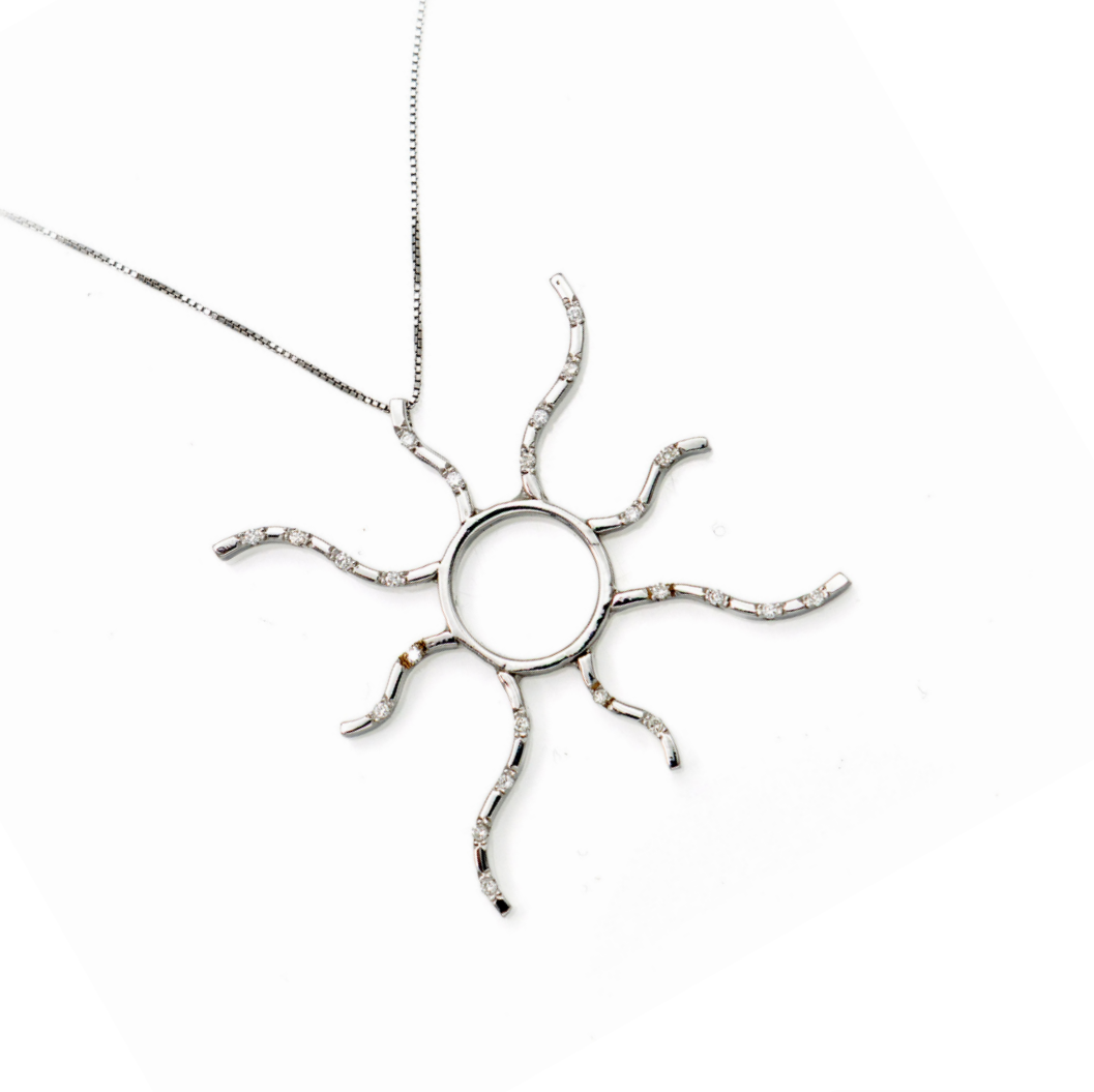
254 PENDENTE A SOLE IN ORO E BRILLANTI Oro bianco 750/000. Peso complessivo gr. 8,70 Diametro cm 5