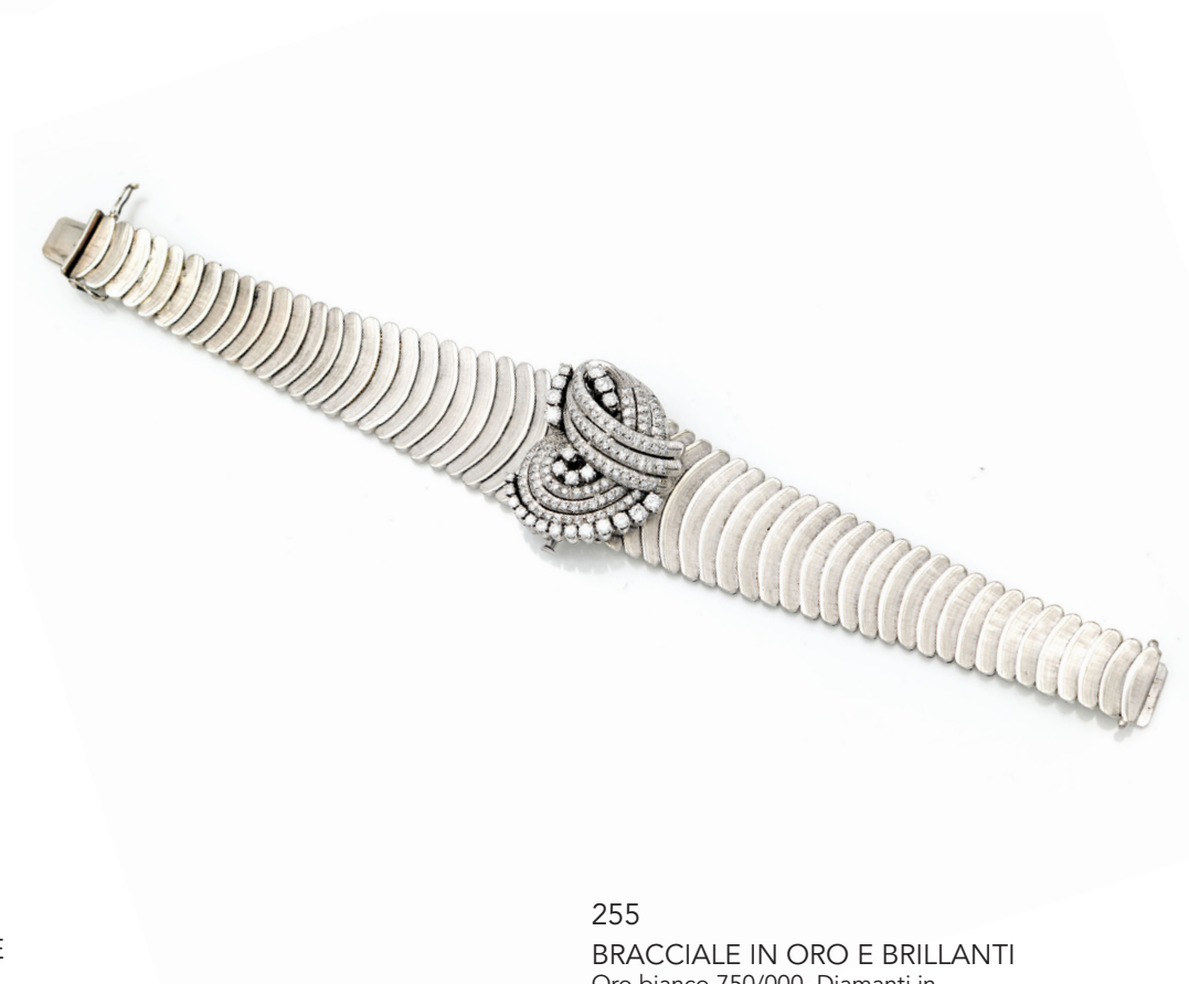
255 BRACCIALE IN ORO E BRILLANTI Oro bianco 750/000. Diamanti in taglio rotondo brillante ct. 3 ca. Peso complessivo gr. 81,10. Spilla centrale estraibile. Lunghezza cm 18