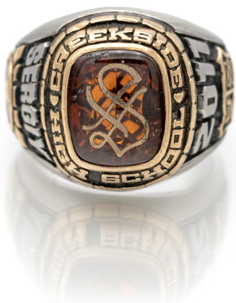
333 ANELLO A SIGILLO IN ORO, ARGENTO E PIETRA CENTRALE. Oro giallo a basso titolo, argento. Peso complessivo gr. 16,40.