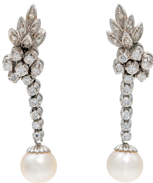
195 COPPIA DI ORECCHINI IN ORO, BRILLANTI E PERLE Oro bianco 750/000. Diamanti in taglio rotondo brillante, perle da coltivazione mm. 9. Lunghezza cm 4,5