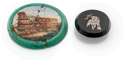
32 COPPIA DI MICROMOSAICI ROMANI SU PIETRA DURA FINE XIX SECOLO