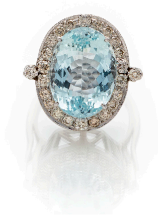
171 ANELLO IN ORO, ACQUAMARINA E BRILLANTI Oro bianco 750/000. Diamanti in taglio rotondo brillante, acquamarina in taglio ovale ct. 8 ca. Peso complessivo gr. 10,10 Misura 15