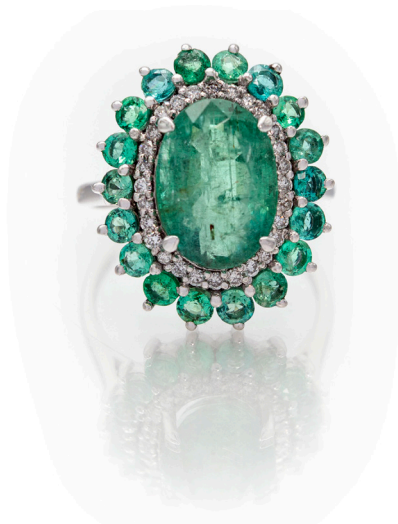
172 ANELLO IN ORO SMERALDO, BRILLANTI E SMERALDI Oro bianco 750/000. Smeraldo in taglio ovale ct. 3,5 ca. Peso complessivo gr. 5,10 Misura 12