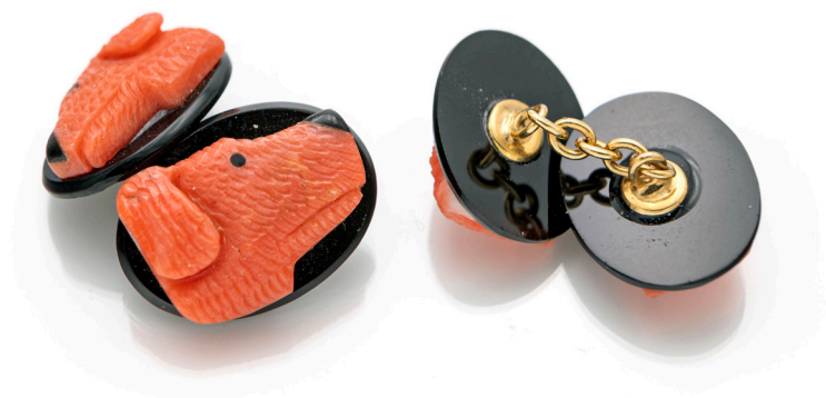
27 COPPIA DI GEMELLI A SOGGETTO ANIMALIER IN ORO CORALLO E ONICE Oro giallo 750/000. cm 2 x 1