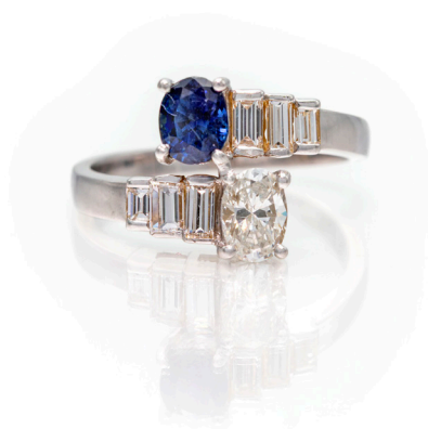
141 ANELLO A CONTRARIÈ IN ORO, DIAMANTI E ZAFFIRI Oro bianco 750/000. Diamante in taglio ovale ct. 0,50 ca, prob G, VVS, diamanti in taglio baguettes. Zaffiro in taglio ovale. Peso complessivo gr. 4,20 Misura 14