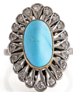
339 ANELLO IN ORO, TURCHESE E DIAMANTI Oro bianco 750/000. Peso complessivo gr. 5,40. Misura 11