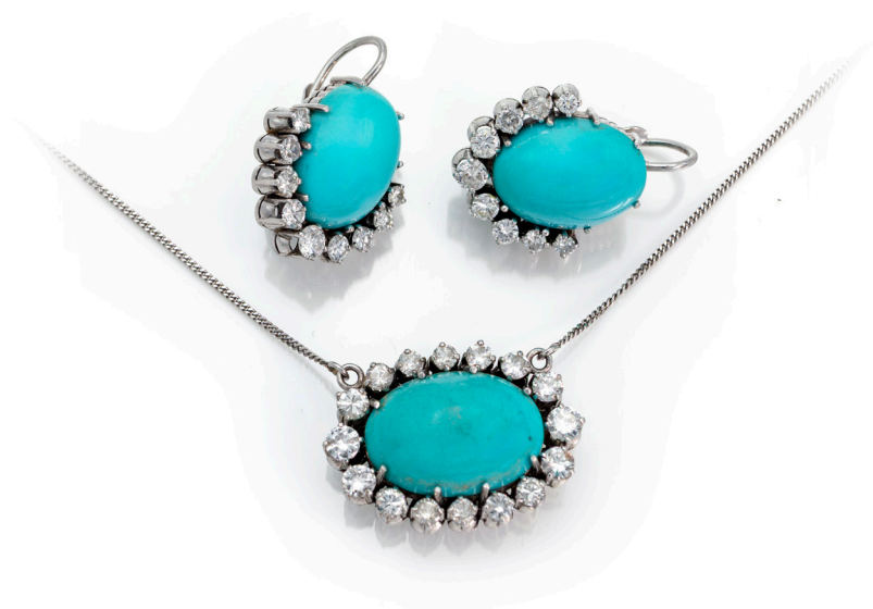
142 PARURE GIROCOLLO E ORECCHINI IN ORO, TURCHESE E BRILLANTI Oro bianco 750/000. Diamanti in taglio rotondo brillante ct. 1,50. Peso complessivo gr. 20,30. Corredati di custodia Massoni, Roma. Girocollo lunghezza cm 40, centrale cm. 2 x 3. Orecchini cm. 3 x 2