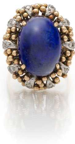
216 ANELLO A CUPOLA IN ORO, LAPISLAZZULI E BRILLANTI Oro giallo 585/000. Peso complessivo gr. 13,60 Misura 19