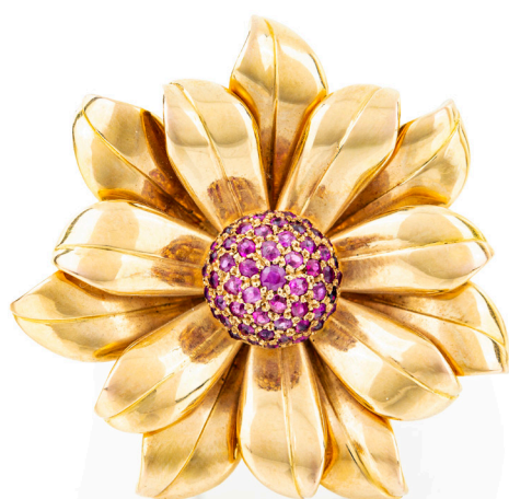
153 WEINGRILL, SPILLA IN ORO RUBINI Oro giallo 750/000. Rubini in taglio rotondo brillante. Peso complessivo gr. 17,20. Punzone del fascio littorio. Diametro cm 4,5