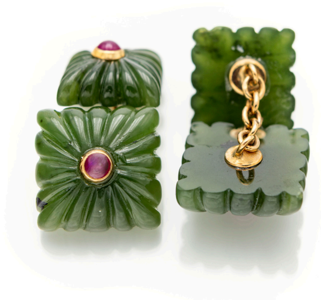
26 COPPIA DI GEMELLI IN GIADA, RUBINI E ORO Oro giallo 750/000. cm 1 x 1