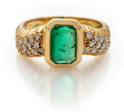
204 ANELLO IN ORO, SMERALDO E BRILLANTI Oro giallo 750/000. Smeraldo centrale in taglio smeraldo, diamanti naturali in taglio rotondo brillante. Peso complessivo gr. 6,80. Misura 13