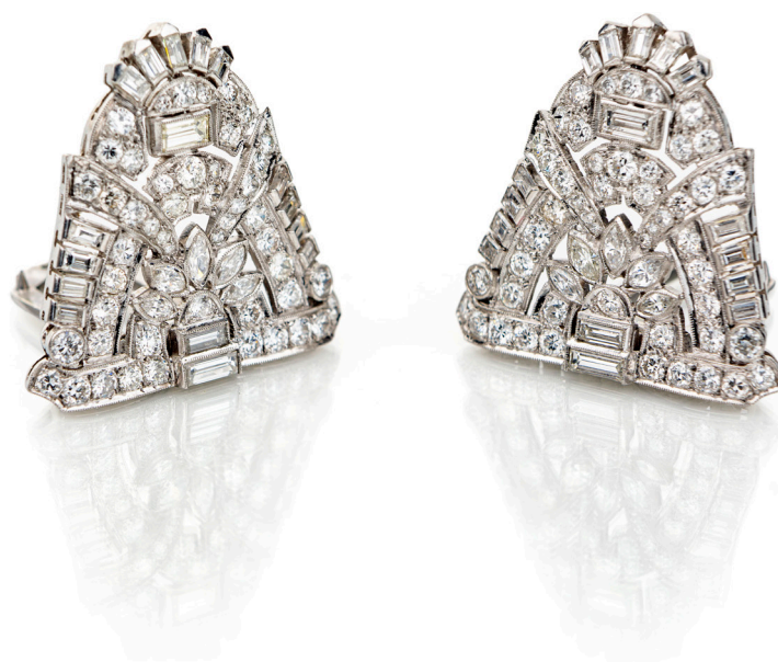
80 COPPIA DI CLIPS ART DECÒ IN ORO E BRILLANTI Oro bianco 750/000. Diamanti in taglio rotondo, baguettes e navette ct. 3,50 ca. Peso complessivo gr. 20,10. cm 3 x 2,5