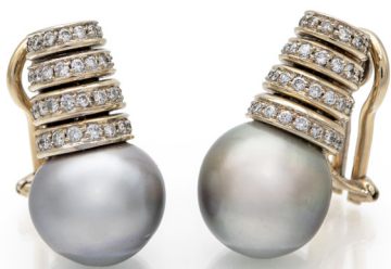
295 COPPIA DI ORECCHINI IN ORO, BRILLANTI E PERLE TAHITI Oro bianco 750/000. Perle mm 13. Peso complessivo gr 19,60. Lunghezza cm 2,5