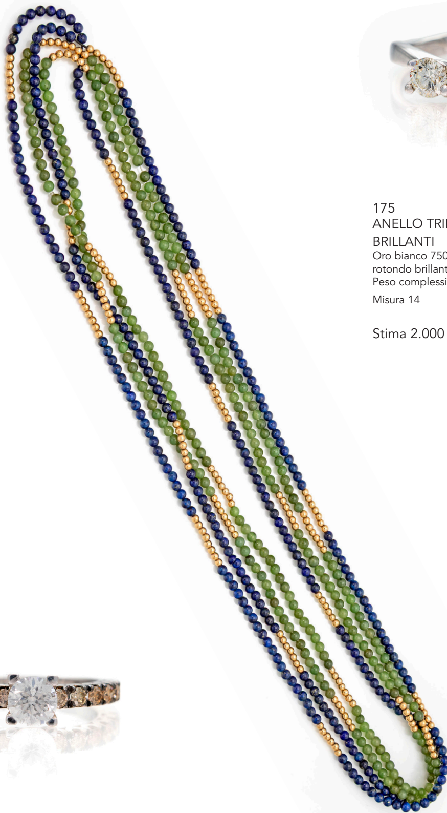
176 COPPIA DI LUNGHE COLLANE A LACCIO IN LAPISLAZZULI E GIADE Lunghezza cm 130