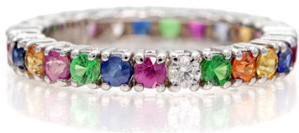
251 RIVIERA ETERNELLE IN ORO E BRILLANTI E ZAFFIRI Oro bianco 750/000. Zaffiri blu, rosa, verdi, gialli e diamanti ct. 1 ca. Peso complessivo gr. 2,90 Misura 13