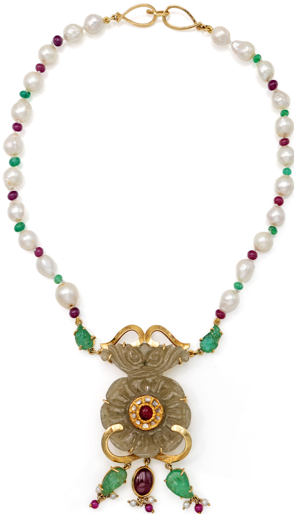
201 COLLANA IN ORO, PERLE, SMERALDI, RUBINI E GIADA. Oro giallo 750/000. Veste cm 41