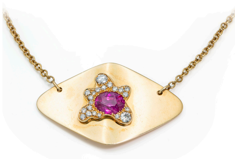
56 PETOCHI GIROCOLLO IN ORO, BRILLANTI E RUBINO

Oro giallo 750/000. Rubino in taglio ovale ct. 3,50, BURMA - MYANMAR, SENZA INDICAZIONE DI TRATTAMENTO TERMICO. Diamanti in taglio rotondo brillante ct. 0,80. Peso complessivo 21,60 gr. Corredato di certificazione gemmologica IGN n° 36552 del 11/12/2024.