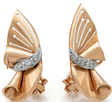
223 COPPIA DI ORECCHINI A VENTAGLIO IN ORO E BRILLANTI ART RETRÒ Oro rosa 750/000. Peso complessivo gr. 6,60 cm 3,5 x 1,5