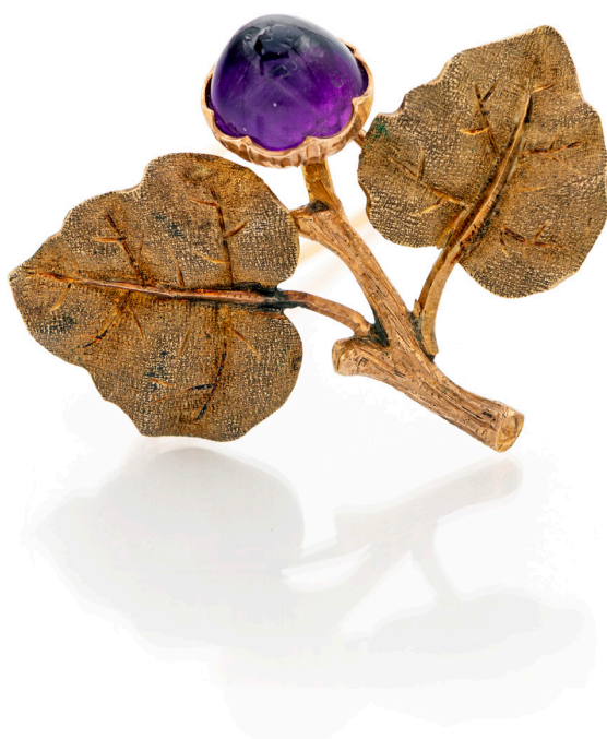
37 BUCCELLATI, SPILLA A GHIANDA IN ORO E AMETISTA ANNI '20 Oro giallo 750/000. Peso complessivo gr. 9,6. cm 3,5 x 3