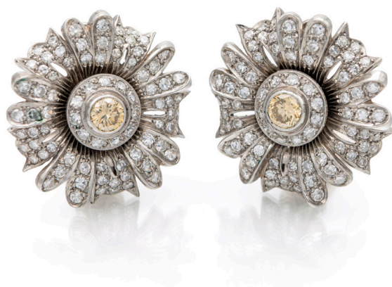
161 COPPIA DI ORECCHINI IN ORO E BRILLANTI Oro bianco 750/1000. Diamanti in taglio rotondo brillante ct. 4 ca., diamante solitario centrale fancy colore naturale ct. 0,80 ca. Peso complessivo gr. 27,10 Diametro 25mm