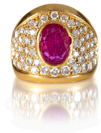
54 PETOCHI ANELLO IN ORO, RUBINO E BRILLANTI Oro giallo 750/000. Rubino taglio ovale ct. 2,50 ca. Diamanti in taglio rotondo brillanti ct. 1 ca. Peso complessivo gr. 9,60.