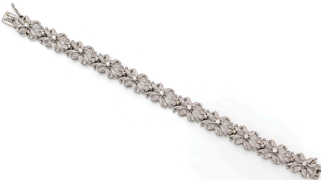
130 BRACCIALE IN ORO E BRILLANTI Oro bianco 750/000. Diamanti in taglio rotondo brillante ct. 0,50 ca. Peso complessivo gr. 27,60 Lunghezza cm 18,5