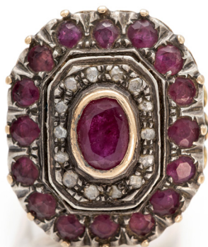
242 ANELLO ORO, ARGENTO, DIAMANTI E RUBINI Oro giallo 585/000, argento. Peso complessivo gr. 12,80 Misura 11