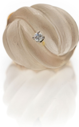
227 ANELLO DA COCKTAIL IN ORO, DIAMANTE E CRISTALLO DI ROCCA Oro giallo 750/000. Peso complessivo gr. 25,80 Misura 14