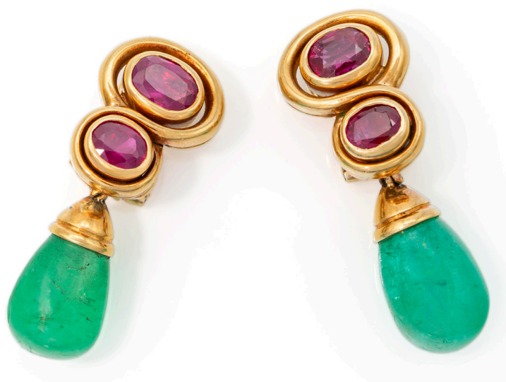
77 PETOCHI, COPPIA DI ORECCHINI PENDENTI IN ORO, SMERALDI E RUBINI Oro giallo 750/000. Rubini in taglio ovale ct. 2,30, BURMA - MYANMAR, SENZA INDICAZIONE DI TRATTAMENTO TERMICO. Smeraldi in taglio goccia cabochon ct. 10 ca. Peso complessivo gr. 13,60. Corredati di certificazione gemmologica IGN n° 36554 del 11/12/24