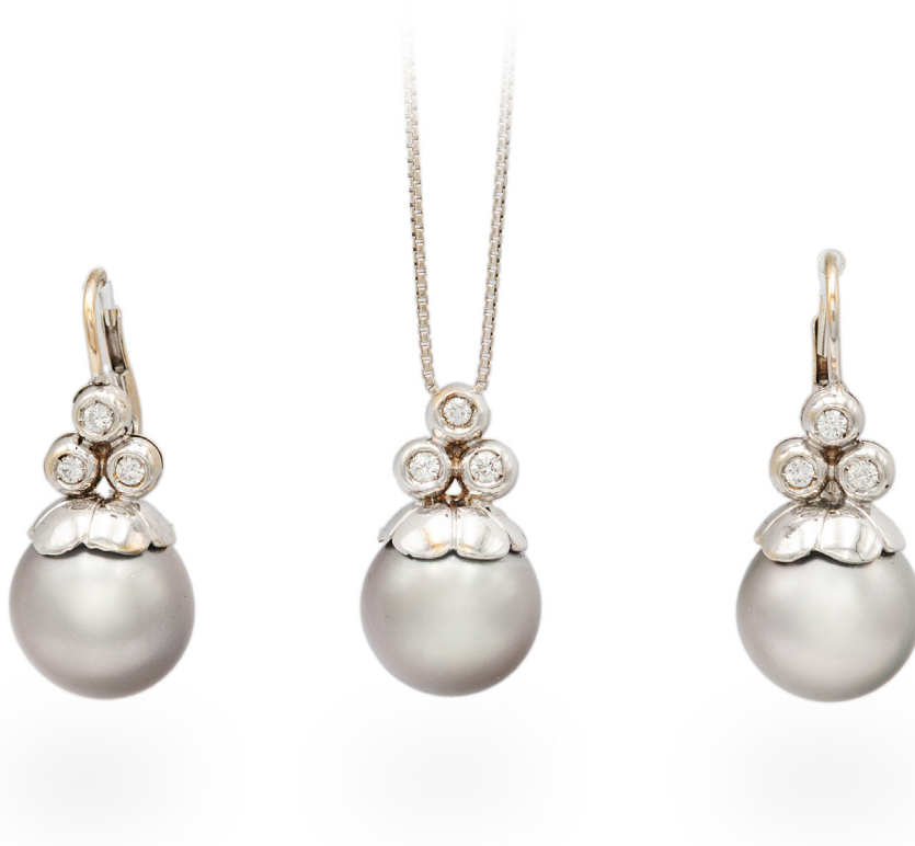
189 PARURE PENDENTE ED ORECCHINI IN ORO, BRILLANTI E PERLE TAHITI Oro bianco 750/000. Perle Tahiti mm. 14