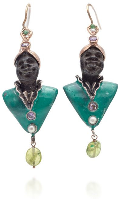
259 COPPIA DI ORECCHINI MORETTI IN ORO, ARGENTO, PERLE AMETISTE E PERIDOTI Oro a basso titolo e argento. Volto in ebano. Peso complessivo gr. 14,50 Lunghezza cm 5,5