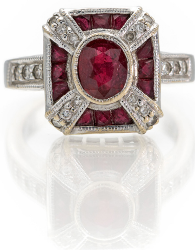
338 ANELLO IN ORO, RUBINI E BRILLANTI Oro bianco 750/000. Peso complessivo gr. 6,20 Misura 12