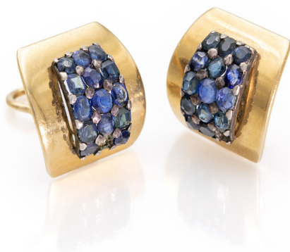
276 COPPIA DI ORECCHINI A SCUDO IN ORO E ZAFFIRI Oro giallo 750/000. Peso complessivo gr. 15,50. Due zaffiri mancanti. cm 2 x 2