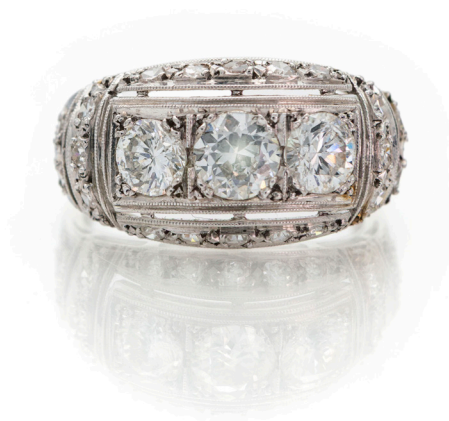
121 ANELLO A CUPOLA IN ORO E TRE BRILLANTI Oro bianco 750/000. Tre diamanti centrali ct. 1,10 circa più brillanti 0,30 circa. Peso complessivo gr. 4,80 Misura 17