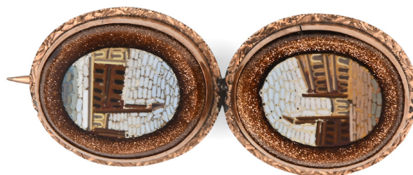
180 SPILLA ANTICA IN ORO, MICROMOSAICO E AVVENTURINA Peso complessivo gr 8 Cm 5x2