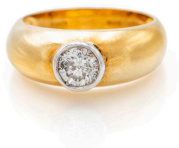
166 ANELLO IN ORO E BRILLANTE SOLITARIO Oro giallo e bianco 750/000. Diamante centrale in taglio rotondo brillante ct. 0,95 ca. Peso complessivo gr. 6,70. Misura 16