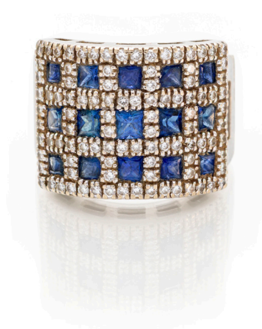
173 ANELLO A FASCIA IN ORO E ZAFFIRI Oro bianco 750/000. Diamanti in taglio rotondo brillante ct. 1, G, VS. Zaffiri in taglio carrè. Peso complessivo gr. 16,20. Corredato di certificazione gemmologica. Misura 12