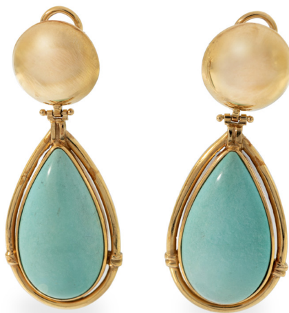
272 ORECCHINI PENDENTI IN ORO CON GOCCE DI TURCHESE Oro giallo 750/000. Peso complessivo gr. 30. cm 6