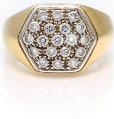
334 ANELLO A SIGILLO IN ORO E BRILLANTI Oro giallo 750/000. Diamanti in taglio rotondo brillante. Peso complessivo gr. 5,40 Misura 14