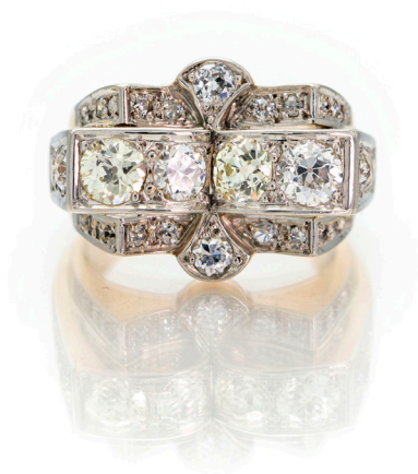
170 ANELLO A PONTE IN ORO E BRILLANTI Oro giallo e bianco 750/000. Diamanti in taglio rotondo brillante ct. 1,40 ca. Peso complessivo gr. 11,80 Misura 16