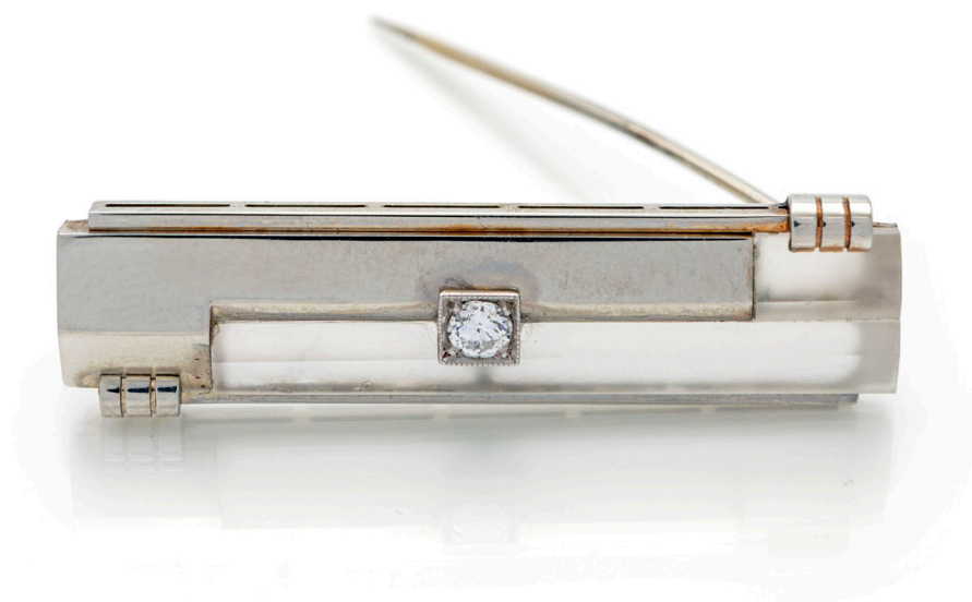
79 SPILLA A BARRETTA DECÒ IN ORO, CRISTALLO DI ROCCA E BRILLANTE CENTRALE Oro bianco 765/000. Peso complessivo gr. 8,50. cm 4,5 x 1,5