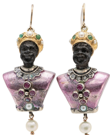
261 COPPIA DI ORECCHINI MORETTI IN ORO, ARGENTO RUBINI, SMERALDI E PERLE Oro a basso titolo e argento. Volto in ebano. Peso complessivo gr. 20,70 Lunghezza cm 5,5