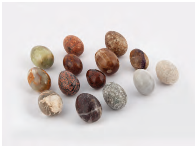
33 QUATTORDICI UOVA DIVERSE IN PIETRA DURA, da cm 5 a cm 7 ca.