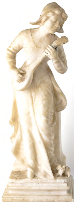
104 TELEMACO CIPRIANI (XIX-XX secolo)

SUONATRICE DI MANDOLINO, altezza cm 50 Sculptura in alabastro, databile ai primi del XX secolo, firmata al retro "T. Cipriani"