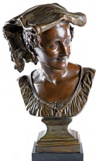
66 JEAN-BAPTISTE CARPEAUX (PROBABILMENTE_DAPRES) (Valenciennes 1827-Courbevoie)