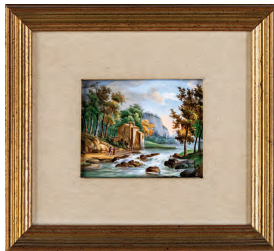
31 PITTORE DEL XX SECOLO

PAESAGGIO FLUVIALE CON FIGURE, olio su porcellana cm 11x14 - in cornice cm 28,5x31 in cornice