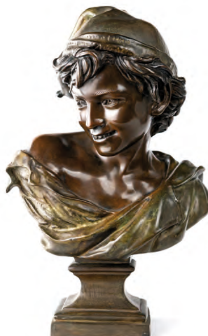
67 JEAN-BAPTISTE CARPEAUX (PROBABILMENTE_DAPRES) (Valenciennes 1827-Courbevoie)