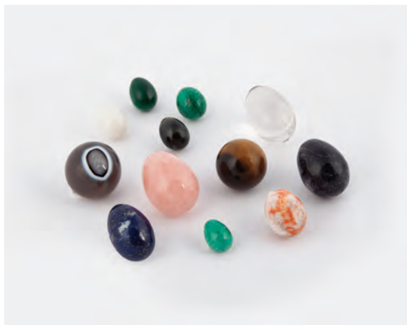
32 DIECI UOVA E DUE SFERE IN MARMO E PIETRE DURE, da cm 2,5 a cm 5 quarzo rosa, cristallo, malachite, occhio di tigre ...