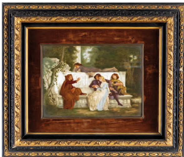
30 EMILIE DESJEUX (Joigny 1861-Parigi 1957)

POETA FIORENTINO (DAL DIPINTO DI ALEXANDRE CABANEL), olio su porcellana cm 23,5x32,5 - in cornice cm 51x59