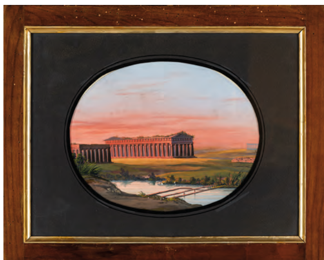
93 PITTORE DEL XIX SECOLO

PAESTUM, gouache su carta cm 23x31 - in cornice: cm 41x52